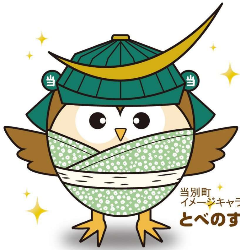
当別町 イメージキャラクター とべのすけ