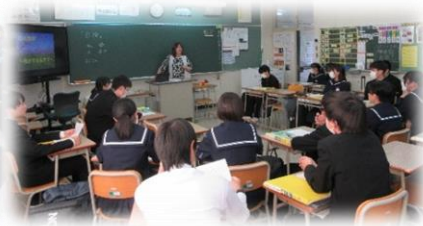
2年生は「思いやり」について