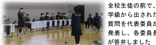
全校生徒の前で、学級から出された質問を代表委員が発表し、各委員長が答弁しました