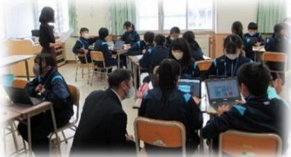
1年生は「国際理解・国際貢献」について

今年度3回目の授業参観・学年学級懇談会を行いました。今回の授業参観は全学年で道徳の授業を公開しました。道徳の授業では「自分自身を見つめる」「人との関わりを見つめる」「集団や社会との関わりを見つめる」「生命や自然、崇高さについて考える」をキーワードに、よりよい生き方について多様な価値観に触れ、深く考える授業が行われています。グループやクラスで意見を出し合ったり、議論したりすることや自分自身との対話を通して、考えを深めています。深めた考えを自分の生活で生かしていけるように、これからもみんなで学んでいくことになります。