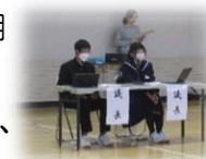
議長を務めた二人

11月7日(火)5,6時間目に体育館で、生徒総会を行いました。前期の活動反省と後期と令和6年度前期の活動計画について、新旧生徒会役員から提案があり、質疑応答が行われました。