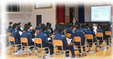
3年生は「家族」について