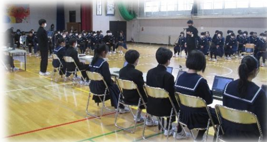
Chromebookで議案書を確認しながら、会議は進みました