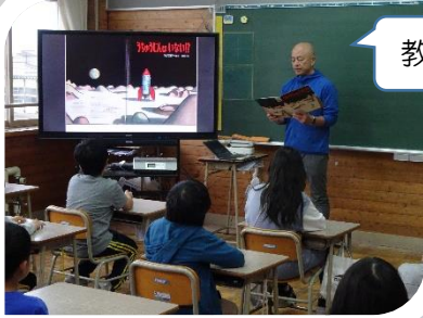
教室の電子黒板を使つての読み聞かせ

11月は読書月間ということで、全校で様々な取り組みをすすめました。読書おすすめカードづくりは職員・児童が取り組み、ときめきルームや学級廊下に掲示し、好きな本の情報でいっぱいになりました。また、担任ではない職員からおすすめの本を読んでもらう「お楽しみ読み聞かせ」もあり、本を選ぶ職員も話を聞く子どもたちも、ときどきわくわくしながら本に親しむことができました。