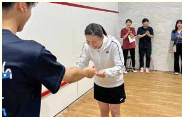
2023年度北海道学生選手権大会で準優勝した時の様子

ここに書ききれないエピソードや写真は 当別町ホームページ「現代を生きる+」 でご覧ください。