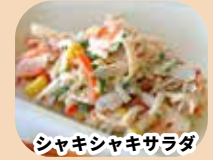
シャキシャキサラダ