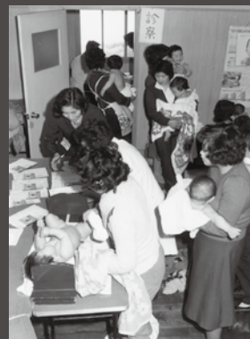
6カ月・1歳児の健康診断の様子 (昭和51年3月)

ますが、農業に従事する女性の健康への配慮が伝わります。『広報とらべつ』を通して、町や保健師の皆さんがそれぞれの時代の問題と向き合い、町民の心身の健康を促進しようと懸命に努力してきたことが読み取れます。