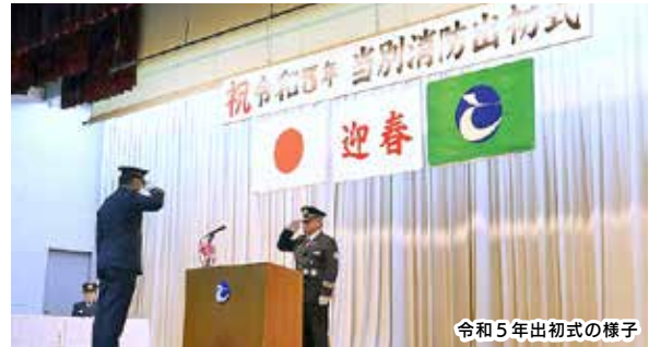
令和5年出初式の様子