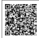
乳幼児健診 各種事業