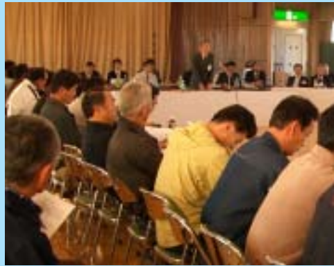
農業経営体の懇談会