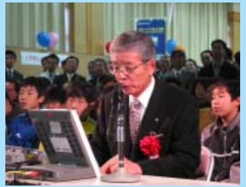
光ケーブル開通イベント