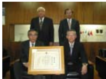
町選挙管理委員会委員のみなさん