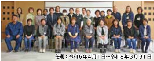
任期：令和6年4月1日～令和8年3月31日