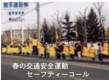
春の交通安全運動 セーフティーコール

夏は、死亡事故が多発する季節です。速度違反や一時停止違反、前方不注意、高速走行でのハンドル操作ミスによる事故が多く、また、暑さや疲れによる居眠り運転が事故に結びつきます。交通ルールを守り、ゆとりある運転で事故防止に努めましょう。