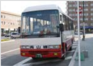
住民生活の利便性を高めるために「バス運行のあり方」について検討し、実現を目指します。