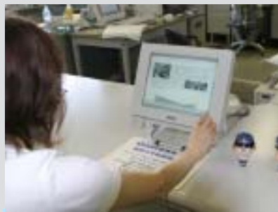
電子申請をはじめ、行政サービスの充実化を図るため「情報通信基盤」を整備します。