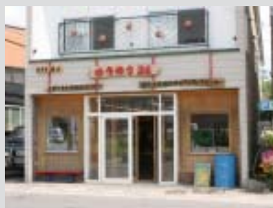
「北海道医療大学との連携」を図り、学生ニーズを踏まえた商店街づくりに取り組みます。