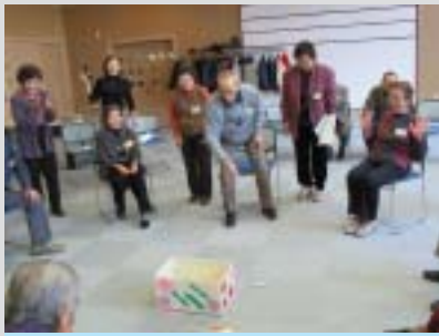
地域福祉計画、介護保険事業計画を策定し「少子高齢化に対応した健康づくり」を推進します。