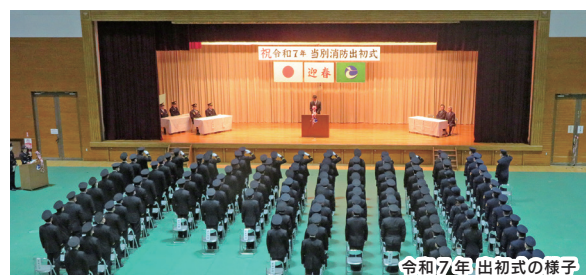
令和7年 出初式の様子