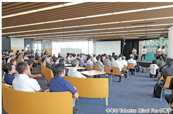
今年の Tobetsu Mirai Fes の様子

問 Tobetsu Mirai Fes 実行委員会事務局（商工会館・☎ 23 - 2447）