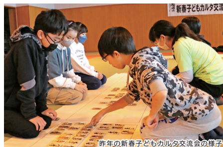
昨年（令和7年）の新春子どもカルタ交流会の様子