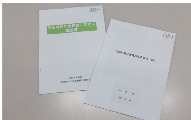
（左）当別町新庁舎建設に関する提言書 （右）当別町新庁舎建設基本構想（案）