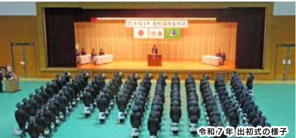
令和7年 出初式の様子