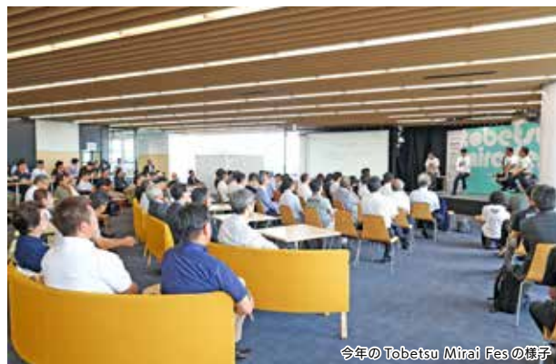
今年の Tobetsu Mirai Fes の様子

問 Tobetsu Mirai Fes 実行委員会事務局（商工会館・☎ 23 - 2447）