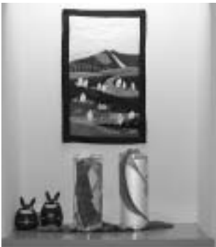
当別ボランティアセンター

ここでは、ゆとりの一角にある「ボランティアさんのコーナー」に展示している四季折々の作品を毎月紹介していきます。