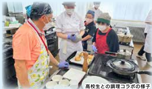
高校生との調理コラボの様子