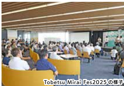
Tobetsu Mirai Fes2025の様子

Tobetsu Mirai Fesは大学移転後の未来を描くまちづくりイベントです。多くの団体・企業・個人がフォーラムやワークショップ、体験会等を通じて、まちづくりや将来のビジョンについて発信することでまちづくりに対する関心を高め、参画者同士の繋がりから、新しい取り組みが生まれることにより、明るく希望あふれる未来を目指します。