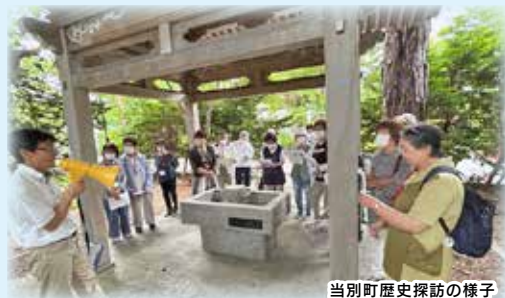
当別町歴史探訪の様子