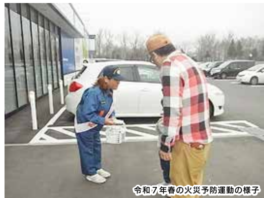
令和7年春の火災予防運動の様子