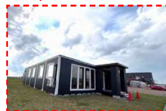
ポップアップストア設置予定地