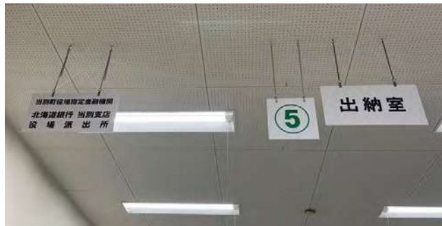
役場本庁舎1階に設置されている派出所と出納室

答 ATMについては今後、行政財産使用許可の更新は行わないとの申し出があったため、今年3月30日をもって閉鎖となる。