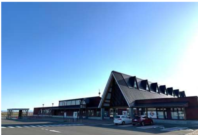
北欧の風 道の駅とうべつ