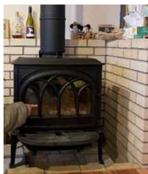
薪・ペレットストーブ