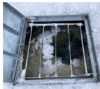
地中熱ヒートポンプ設備