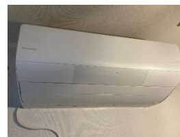
寒冷地エアコン（14畳用）