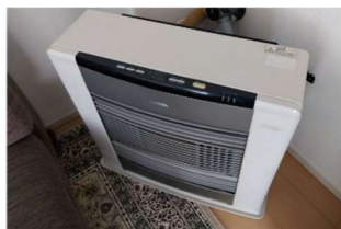
石油・ガストーブ