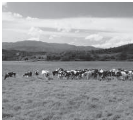
町有牧野のその後の経過はどうなっているのか

は各部毎に枠を配分し、各種制度を取り入れ、その中で歳入に見合った予算編成を行う。各部署で徹底した事業の再評価をし、再構築をするように私から強く指示をしている。 問 三番川地域の牧場の道に買い上げてもらうことになっていった件はどうなっているのか。 町長 町有牧野については、今も道に全面的に買い上げていただきたいという期待を持ち続けており、予算編成までには道の話も聞かなければと思っています。