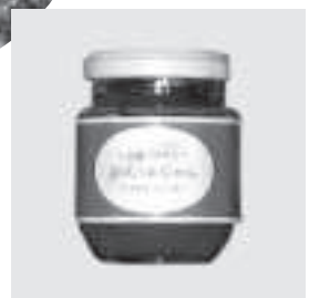
地元産のニンジンから作ったジャム (ふと美レインボークラブ)

町長 商業関係において、販売や流通、営業、制度融資の情報提供、農家と消費者間の農産物に関する情報、専門技術を持つている方などの情報提供など、それらについては、今後、積極的に進めていきたいと思っております。