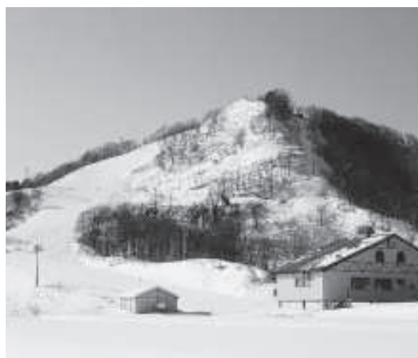
スキー場跡地の有効活用を

教育長 町内の小規模校を特認校に指定することについては現状としてはなじまないと考えている。