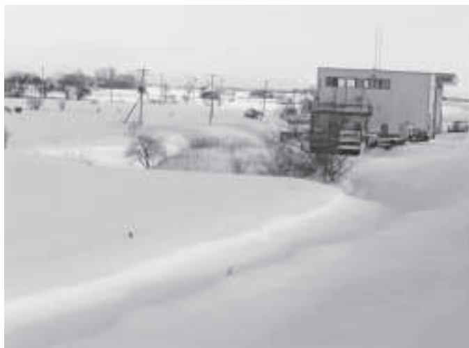
ビトエの堤内排水

齢化し少数化してきた農村を維持するための農家の苦労は、十分承知しているが、やはり地域を守るためにいままじし地域で努力をしていただき、町全体がそれに支援するという気持ちになるようにすることが必要だと思われるので、まずは自助努力をお願いしたい。