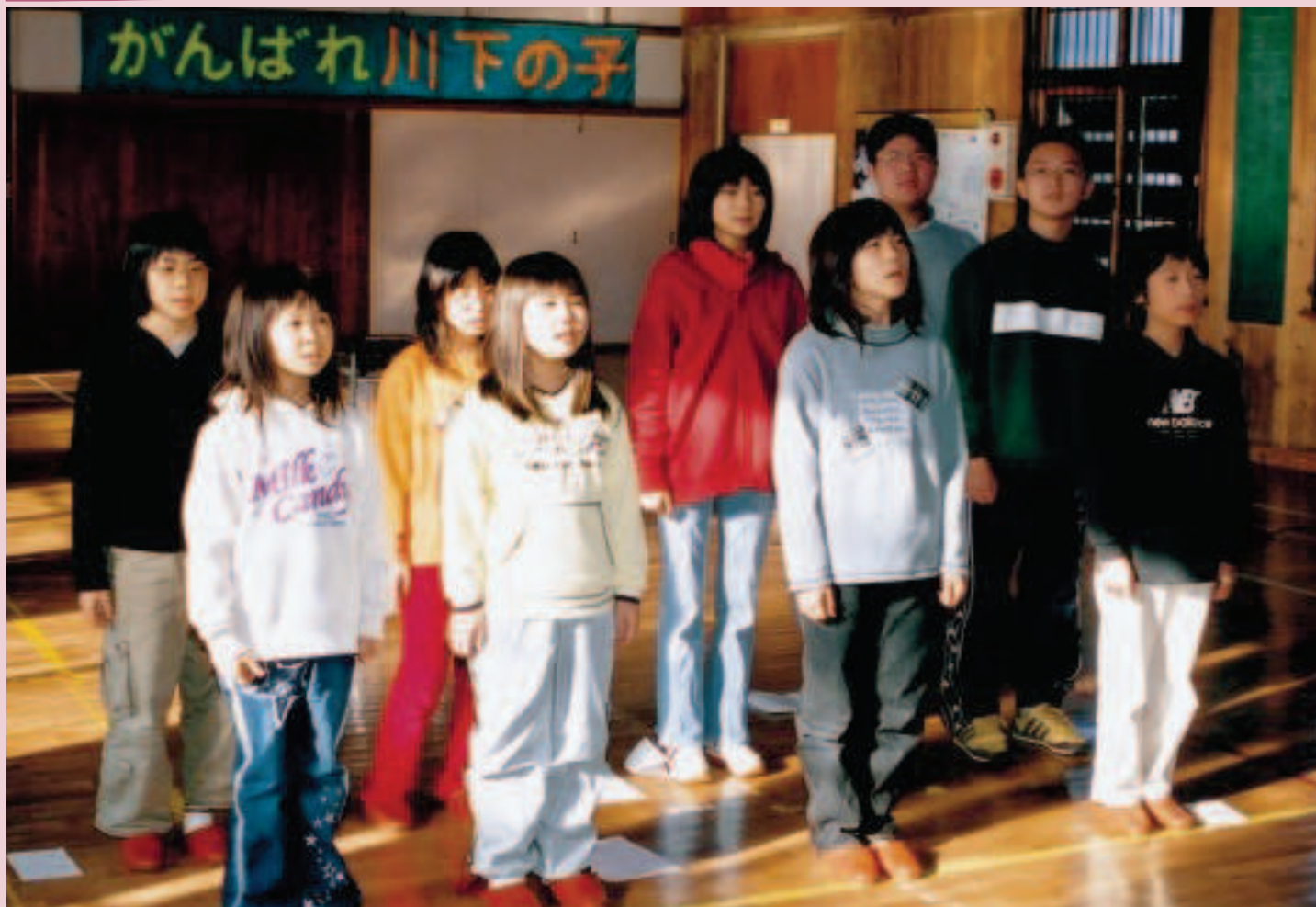
開校100年の歴史、最後の始業式を迎えて（川下小学校 1月16日）