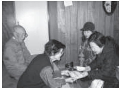
ボランティアの方による配食サービス

問 配食サービスについて、住民に不公平感が起きない取り組みが必要であり、当別町全域での取り組みが必要ですか。配食サービスについては、ボランティアさんの労力に対して有償ボランティアで行うべきです。さらに、全域での対象者に対し、配食サービスのニーズ調査の実施を行うべきです。