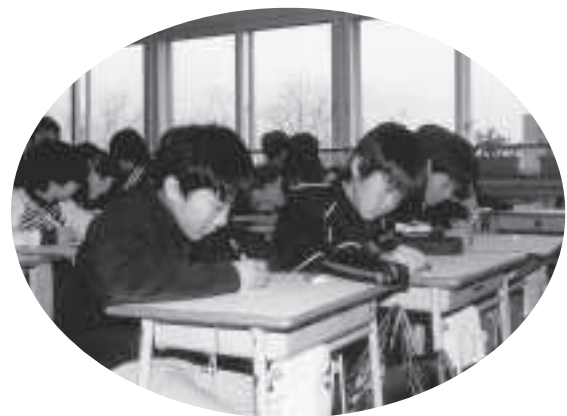
学校評価を導入し、各学校でのシステム化を

問 通学区の関係ですが、現状の第四学区が札幌市内のいわゆる特別学区の選択幅が広がった点につきましては、父兄あるいは生徒の受けとめ方として、私も、一定の評