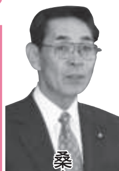
桑内 雅彦 議員