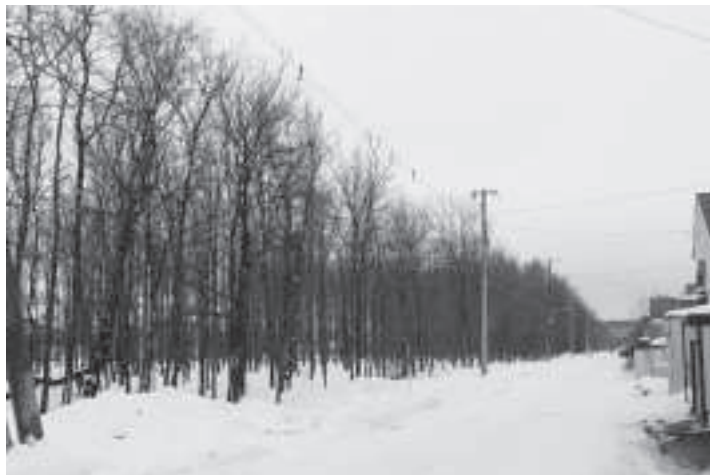
防風保安林を緊急避難場所に

問 基幹産業をベースにして地域おこしを行う団体については、行政はハード、ソフト面から支援を行い、自立・創業ができる様にすべきである。