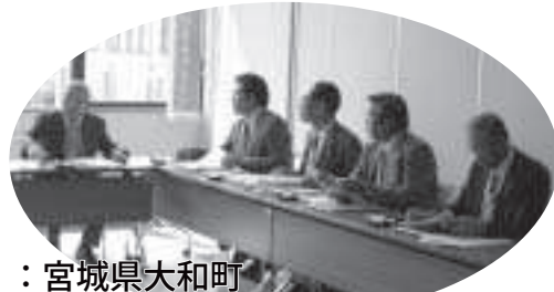
：宮城県大和町 活発な意見交換がされました。