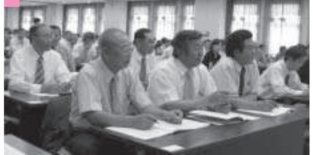
議会広報研修会：札幌市 今号発行の議会だよりの参考に・・・