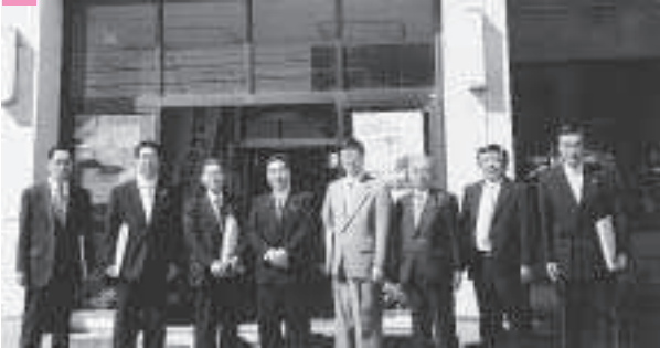
上：秋田県天王町 下：宮城県大河原町 十分に色んなはなしができた・・・ すがすがしい面持ちの委員さん。