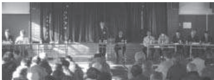
当別町水田農業ビジョン 地域説明会の様子

いくのを難しいとは考えていない。国に対して単一的に法人化することの方がナンセンスだと要望し続けていきたい。 当別町では水田農業推進協議会があり、充実した農家づくり、自立したいができない方々を組織化していくこと等を協議している。今後も産地づくり交付金について、当別町の水田農業推進協議会ですらに協議されると考えている。