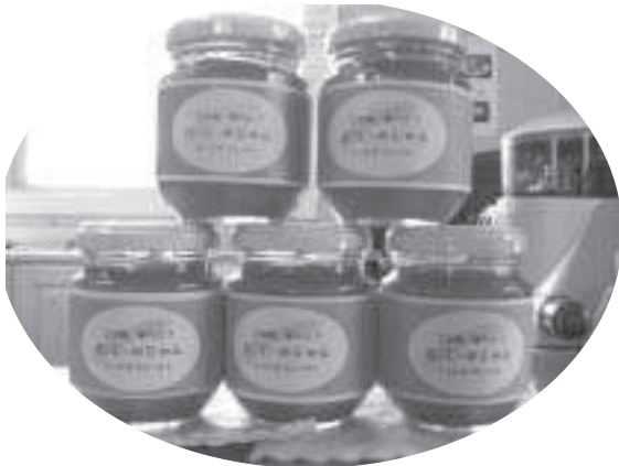
にんじんのジャム。食べたらずみつき!?

要な責務の絶対条件として、例えば、異物混入の100%防衛。安全な給食作りのため就業職員の健康管理。食材の吟味、検査。運搬時の衛生確保等がある現在の給食センターの体制の中では、発議のような事業の同時展開は、衛生上非常に難しい。 給食センターの有効活用について、例えば今後保育所の給食などに有効活用していくことは行財政システム再構築プランの中で多くの人に検討していただきたい。 したがって、地元農産