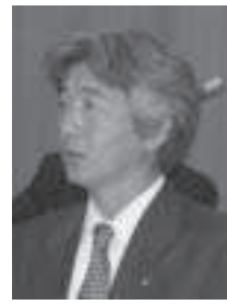
高谷 茂 議員