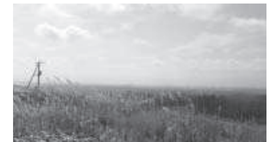
民意の決断を静かに待つ展望公園用地。 (秋の虫の音が心地よい)