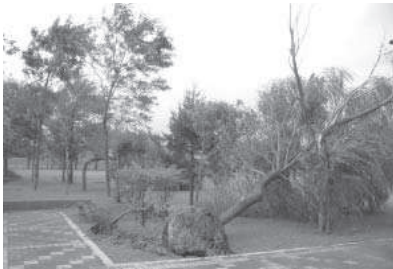
土台（根）の重要さがわかりました。 町の根も丈夫に育てよう！