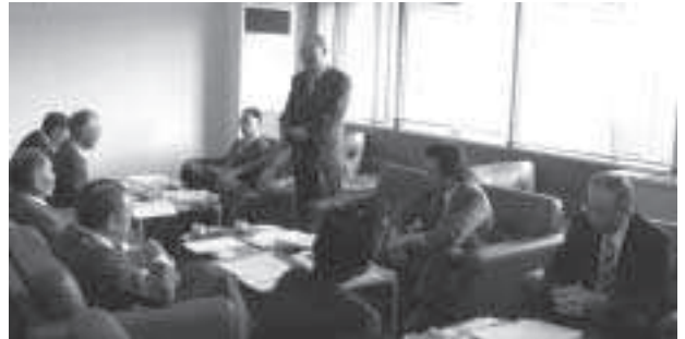
：宮城県河北町 研修の前にまずは委員長の挨拶から・・・