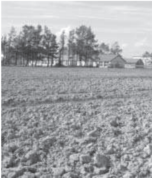
都会と農村をつなぐ公園予定地

備、利用、維持管理計画について伺いたい。 町長 現在、関係機関と内容を検討している。財政事情から、七百億円超の事業一環であり、当初計画通りの施設整備は困難であると考えている。地域、改良区等と連携し、事業の目的である景観整備、ファミリー農園を運営してきたこと等を踏まえ、都市住民との交流により、地域が活性化されるような施設となるように検討したい。 事業は、平成十八年度、平成十九年度の実施計画となっている。