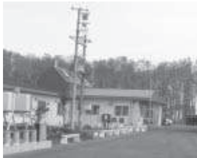
隣り合う町と民間の老人ホーム