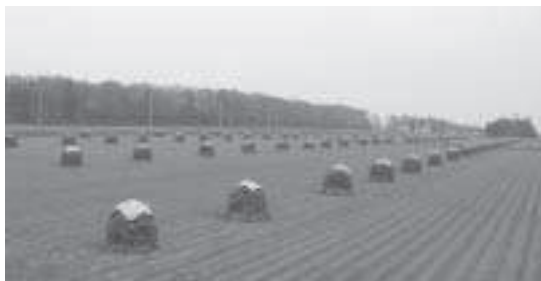
秋の風景は 筆をとってみたいくなる。

が各々五十六のグループに属し、また、グループに属さない認定農家八十八戸が、合わせて新たな制度の担い手としてスタートした。しかし、今なお担い手となっていない、二百六十戸の個人単独農家を、さらに「認定農家」のみで、支えることは困難な状況にあることから、組織（グループ）化を進めているものである。