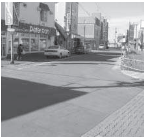
冬期にはツルツル路面が予想される交差点

交通量の多い交差点の路面のつるつるな状態の安全対策としては、環境に配慮して砂などを散布するとともに安全な路面の確保に努めてきたが、今年度もさらに道路のパトロールを強化し、適切で、効果的な散布などを行って、路面の安全に努めたい。