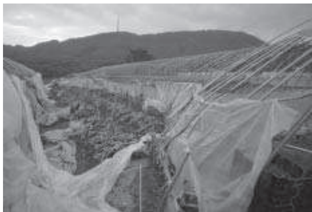
寒空のもとにさらされた花たち。 これはビニールハウスです！！

今回、通常よりも著しく強い風の台風18号が当別町を走り抜けました。被害がでたのは云うまでもありません。復旧に伴う仕事が急ピッチで進んでいます。