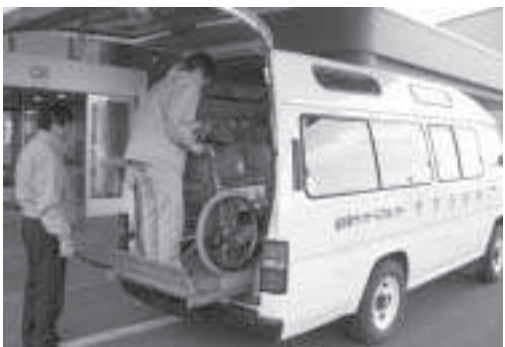
やすらぎバスで、やすらぎを届けます。

介護保険制度は、身近なサービスとして定着してきたが、制度継続のため、国の大幅見直しが行われることとなり、町も現在第三期の介護保険事業計画を策定中である。介護保険サービスには必ずしも軽度者の状況改善や悪化の防止にならないと指摘があり、自立につながる新しい予防給付が始まる。このサービスは、本人、家族、ケアマネジャーがサービスについて検討し、自立に向けて計画を立てていくこととなる。