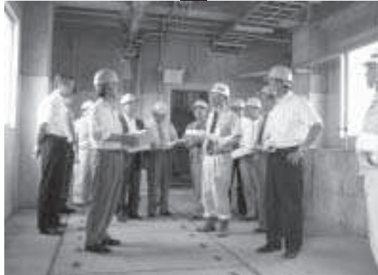
当別下水終末処理場視察