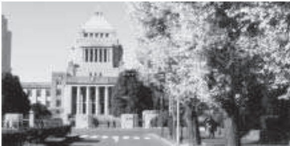
国会議事堂には地域の声が集まってくる。

町長 行財政システム再構築プラン実現に向けて当別町が自立するため、かつて地方六団体が要望したようなことを堅持してもらうため、また、北海道町村会などの立場でも関係団体と一体となつて、人口の少ない自治体が地方財政調整機能を堅持してほしいとしっかり申さなければならぬ。私自身単独でも、自分の人脈、国会に關係する方々を通じて、地方の財源が中央へ流れてしまうことでは困るので、実質