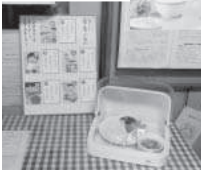
今日の献立なーにかな。

特に、食料を生産する町としては、食料の生産がいかに大切に重要かということ等を四歳、五歳の子供から学ぶ、そういうことを家庭からしつけるような家庭のあり方を目指したい。