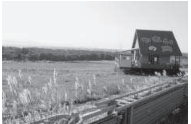
高岡には小樽まで展望できる場所も…

この間、行政改革に取り組み、行財政システム再構築プランを策定するなかで建設事業費を大幅に縮減したこと、展望公園と一体として整備を予定していた歩道整備計画年度も後年に変更せざるを得なくなりましたので、代替策を検討していたところ、議員発議のとおり、幸にして獅子内から高岡に通ずる旧道が現在も使用でき、ロケーションにも優れているこ