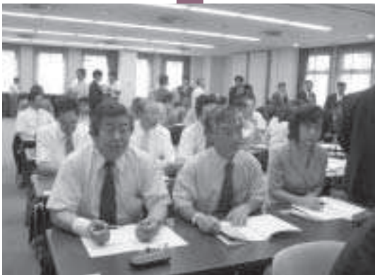
熱心に聞き入る議会広報委員