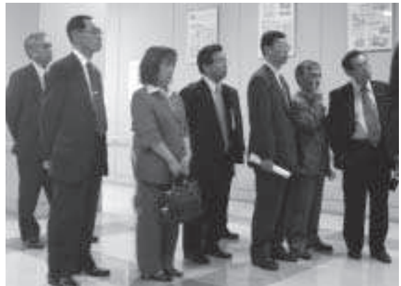
熱心に施設見学 (登別市 廃棄物管理型最終処分場・クリンクルセンター)