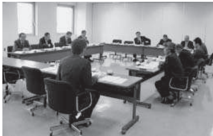
議会改革について先進地で研修中 (美瑛町)

意見の中には町長部局の動向を見極めてという意見もあったが、全体として、やはり議会も汗を流すべきだということ