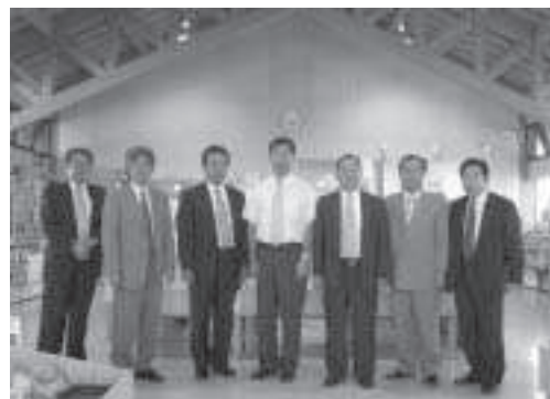
「道の駅」230レスツの地元野菜販売コーナー視察