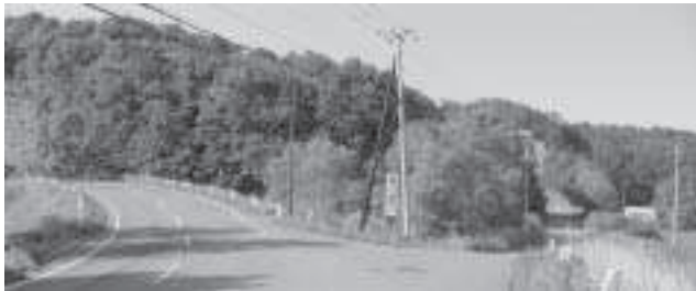
排気ガスを吸わずにハイキング。

本プランは当別町の大改革であり、これまでと違う視点で、最初の段階から町民と協議するという特色、また、改革は明確な目的が必要であり自立し、安心して住める美