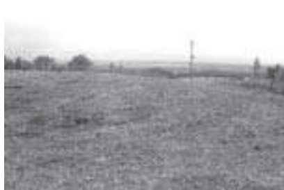
秋の虫の音をききながら…景色をながめます…

域の資源を、地域の団体が資源保全をしようとする動きに対して、何らかの支援がなされると考えている。来年度の百億円は、ぼつとしている農家には当たらない。農家以外の方でも地域の資源を保全する動きは、町長が認定すれば、多分それはオーケーになる。そういうことを当別の農業者は、真剣に考えていただきたい。