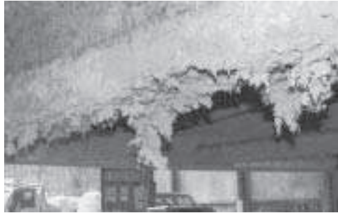
アスベストはこんなふうに使われている。(写真は当別町内施設とは関係ありません。)

環境対策部長 管理体制は、各施設の管理者が施設管理しており、現体制を徹底し、必要最小限の者の出入りにとどめる。住民への情報提供と相談体制は、広報紙十月号やホームページでお知らせするほか、厚生労働省や北海道が発信する関連情報を提供する。