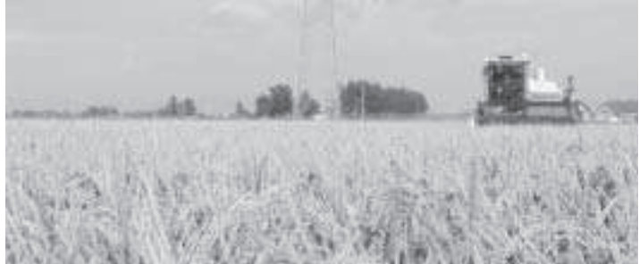
黄金色の大地が収穫の時を迎えました。

町長 町の試算では、国が示すプロ農家である認定農家のみの育成は著しい農家数減少となり、残った農家が膨大な負債を背負う。必ずしも農地集積が進まない状況で、ほとんどの農家は四千五百万円も負債はできないと考えられ、不耕作地が随所に発生する。