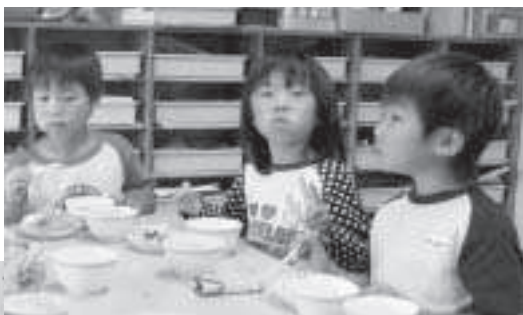
おいしいね。ごはんは楽しくたべよう!!

る」と定義近年、未来を担う子供達の行き過ぎた欧米食。これらが生活習慣病、そして荒れる、切れるなど子供の問題行動の要因となる。食の大切さは幼児期からの学習体験が重要と。群馬県初で遊びながら学ぶ「食育かるた」が全国的に話題を呼んでいる。本町も健全な子育て支援事業の一環として「食育かるた」の導入を。