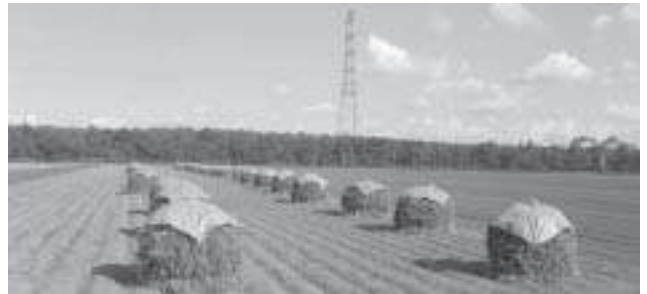
秋の畑は心を落ち着かせる…

問 八月二十六日付けの農業新聞で十八年度の農水省の概算要求で百億円規模の営農集落への予算要求が盛り込まれたとの記事に関してであるが現在、我が町が取り組んでいる形が今回予算化されて来る内容に該当になるのか否か国から示されてくる情報の公開をいち早く示してほしい。泉亭町政はもとより町内農業団体挙げて当別の現状を踏まえた要望を国の農政に向かつて要請し続けて来たが十九年度から導入される経営安定対策、国の農政のなすがままに委ねるなら昨年春の集積を大