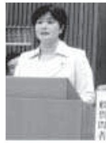
山田 明美 議員