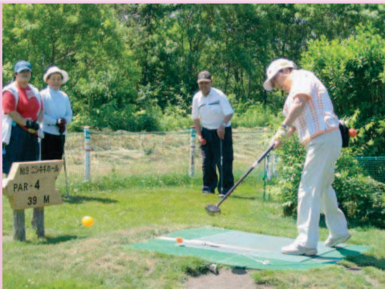
フラワーパークゴルフ場