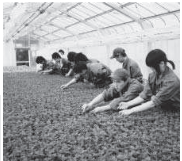
未来の農業を担う若者達

しようと準備を進めてい ますけれども、恐らく当 別高校としても、農業科 の存続ですとか普通科へ の転科を視野に入れた取 り組みが今後なされると 思われるが、地域の高校 を支援するという意味か ら町として今後どのよう に取り組み対応するのか。