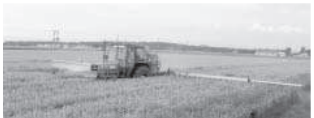
夏の麦畑～防除作業進行中

町長 今当別町ではこの 一年間で農家数が九百か ら、地域組織により、七 百になり、二百が農家で なくなつた。何もしない でいると当別農業・農村 環境は崩壊していく。地 域を壊さず農業を持続す るのはグループ化であり、 当別町の水田農業、ビジョ ンを五十六の組織構成員 以外の方々にも理解を深 めていただきたいと考え ている。私は単に指導者 を支援するのではなく地域 営農そのものを支援して もらいたいと国に強く要 望をしている。