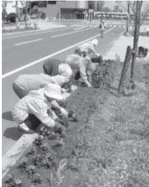
花壇の手入れは快晴にかぎるね！