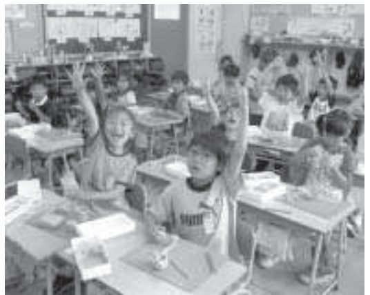
屈託の無い笑顔がこぼれる授業中

問 子どもの健全育成サポートシステムの協定について、個人情報保護審査会に諮問された。審査会では現在の学校と警察との連絡会議で十分であること、学校で誰が対応し指導するかなど、危惧する意見が出され継続審議となった。