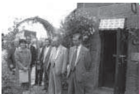
(オープンガーデン)