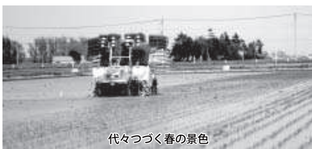
代々つづく春の景色

幹産業を維持するため、農業所得維持のため、所得を高めるため、地域営農の中で知恵を出し合い、異業種の方々の参入の推進を図るなどにより懸念される農業課題に対応していきたい。なお、国に向っては私と堀議員と一緒に上京し本当の声を大にして、体を張って主張してきたつもりである。