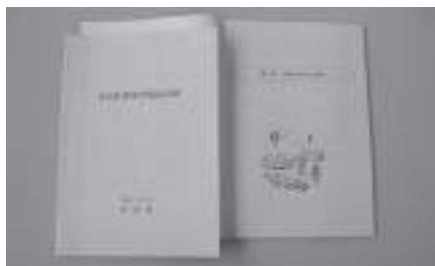
今後、見直される当別町障害者福祉計画

福祉計画」の見直しをする。地域生活支援事業への取り組みについては、支援費にかかわる予算は拡大してきており利用者の抑制やサービスの低下を招いているとは考えていない。