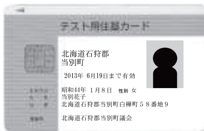
運転免許証がないときの身分証明書にも・・・

町長 現在、住基カード発行数は約五十件で、利用率が低い要因はカードを多目的に利用する社会的環境が整っていないこと、また安全性に関する不案内も大きな要因である。しかし、電子自治体構築にとともに、住基カードの利用は住民生活上様々場面が想定されるので、国や北海道とも連携を強化し、安全性には十分な配慮を行いつつ、カード及びシステムの有効性や安全性を広報、ホームページなどあらゆる媒体を使って町民に積極的にお知らせしたい。