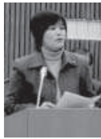
山田 明美 議員