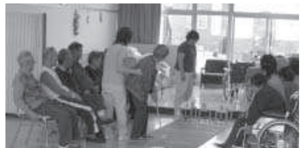
みんなできると楽しそう。(デイサービス)

問 新年度に介護保険の見直しがあるが、今サービスを受けている人たちが、法改正によって、介護度が低い人はデイサービスやホームヘルプサービスから除外されるとい