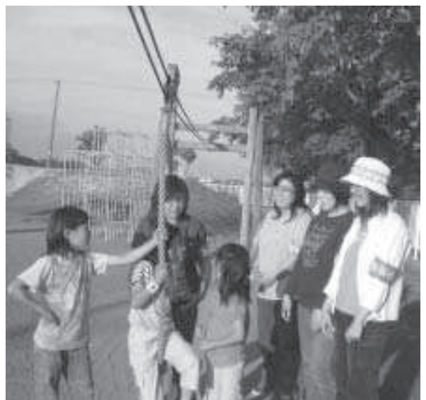
大人（地域）が子供を見守っている。 (防犯パトロールで犯罪抑制効果を！！)

町長 昨年五月に組織された西当別地区防犯会議は教育機関と連携し、情報交換、啓発文書配布、防犯パトロールなどを行い、一定の抑止効果が上がたと聞いており、今後、この活動事例を参考にし、地域で取り組みが広がるように当別町防犯協会の役員である行政推進員とも連携し、協働で防犯体制を進めたい。