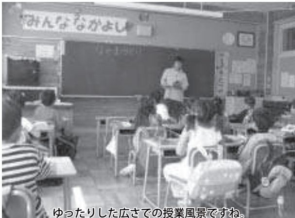
ゆったりした広さでの授業風景ですね。

町長 国の三位一体改革推進による地方歳出抑制方針から、本町財政はさらに厳しくなると予想される。簡素で効率的な行政システムを確立し持続可能な行政運営を目指すために、行政システム再構築プランを策定するが、今後とも町村会などを通じ、国や道へ当別町が自立するために積極的に必要な要望を続ける。