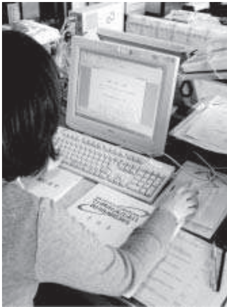
秩序あるインターネット通信環境を・・・

一部自治体に見られる誹謗、中傷の場になる危険もある。それらを十分考慮した活用を考えるべきと思うが。