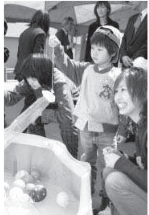
4月16日(土)「NPO法人当別町青少年活動センターゆうゆう24」開所セレモニー後の町の駅にて

第一回臨時会は、二月二日に開催され、(ゼロ国)当別下水終末処理場機械設備更新工事について、議案一件が原案可決されました。