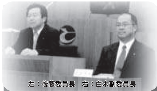
左：後藤委員長 右：白木副委員長