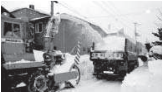
町民を苦しめた異常積雪

町長 行財政システム再構築プラン中にあるように、平成十七年度中に、身近な生活道路の除排雪は、行政のみがすべて行うのではなく、住民と行政の役割分担を明確にし、住民と行政が協働して維持管理をいかに進めるかについて、パートナーシップ方式等も含めて検討していく。