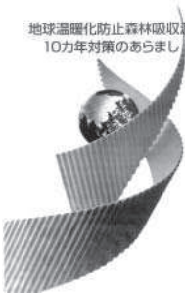
地球温暖化は地球人みんなの共通課題

二点目に、環境ISO 2001の導入や、自己宣言方式について、公共施設ごとに電気使用量、ガソリン使用量、コピー使用量、水道使用量、ごみ排出量などにおいて目標数値を定め、取り組むべきである。