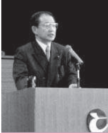
北海道議会議員 内海英徳氏