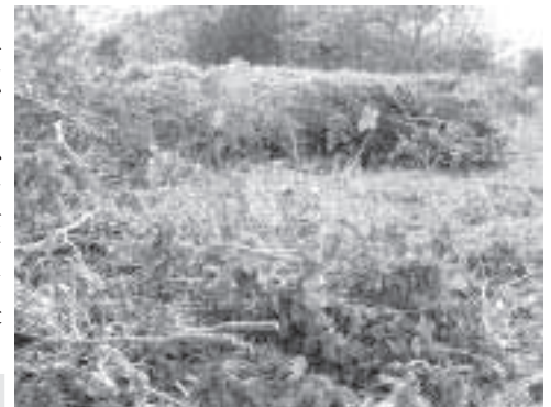
展望公園予定地の雑木伐採後

問 現在、展望公園については06年度までに西当別連絡協議会で答申を出すことになっている。現在、素案について獅子内、高岡、スウェーデンヒルズの三町内会において話し合いが持たれているところである。 一点目に、なぜ木を伐採する維持管理を行ったのか伺う。 二点目に、維持管理の内容については、地域自治会等に説明し、同意をしてから行うべきである。