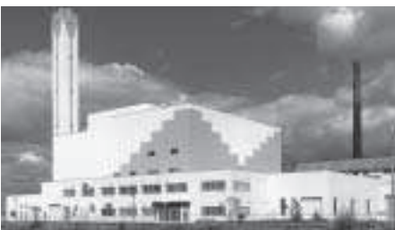
石狩市厚田区に建つ 北石狩衛生施設組合

町長 メリットについては、組合の解散は、運営経費の一層の節減と組織のスリム化が図られることから、事務委託に伴う費用負担の節減につながるものである。