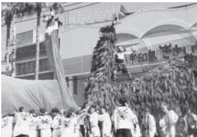
当別町、姉妹都市・岩出山町と同系統の祖先をもつ、宇和島市うわじま牛鬼まつり・親牛鬼パレードは大迫力！

の合併にあたり、両町交流の証として、岩出山町民亭が本町を訪問し、帰町の際、当別駅での感動的な別れは、改めて両町民の絆の強さを思い知らされた。合併により時間的経過とともに、この絆が希薄になっていくことがあつてはならない。岩出山町との交流を続けていくために、岩出山町が仲介役をしてきた宇和島市との交流を進めてまいりたいが、当面、行政間で交流のあり方について検討を加え、将来的に住民同士の交流に発展させていきたい。