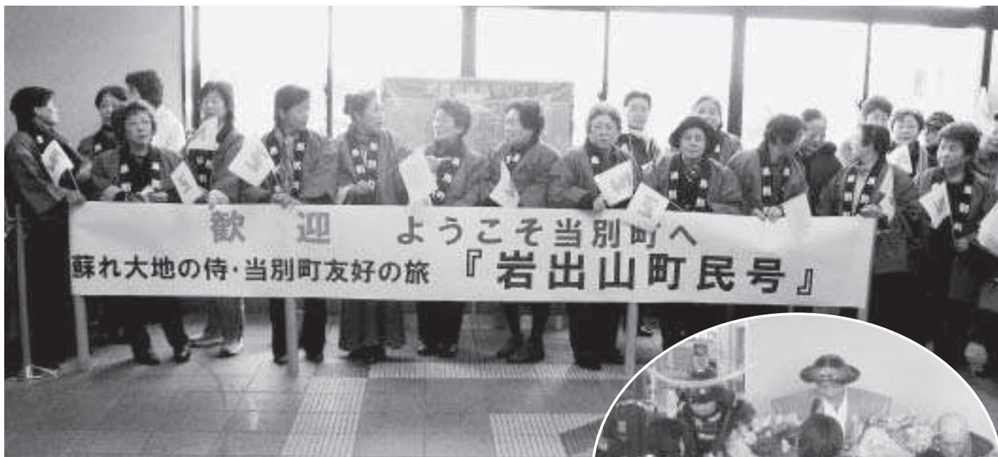
石狩当別駅にて、いまか、いまかと心はずませ『岩出山町民号』を待つ当別町民