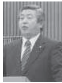
白杵 英男 議員