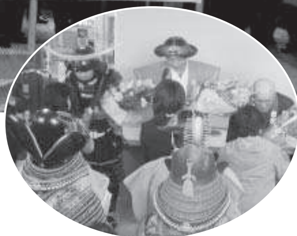
岩出山町民代表者への花束贈呈