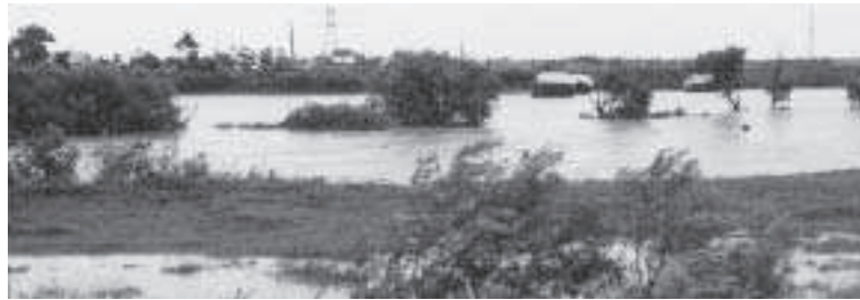
災害を経験した町民は、その体験を忘れない……

内容が実態と異なり、当別町民に混乱を招く意図のあるものと思っております。順を追って私の考えを述べる。