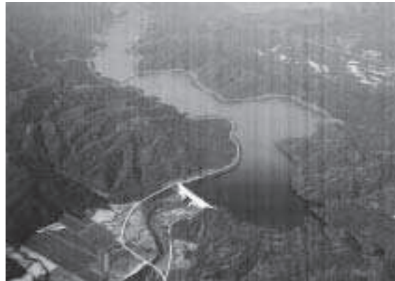
当別ダム完成予想図（平成24年完成予定）

ない。生命と暮らしを守る立場から一日も早いダムの完成を道に求めるべきと考え答弁を求める。