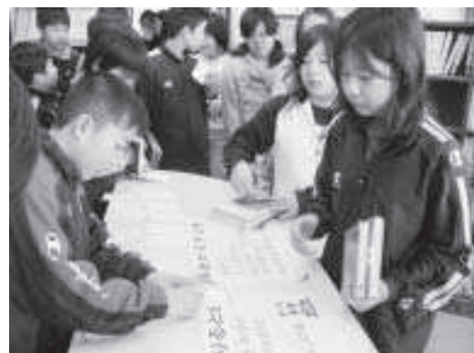
図書の貸出（当別小学校図書館）

問 北海道は子どもの読書活動推進計画の策定を既に08年十一月に策定されている。基本理念の中には北海道のすべての子どもがあらゆる機会とあらゆる場所において自主的に読書活動を行うことができるように、積極的にその環境の整備を図ることとしている。