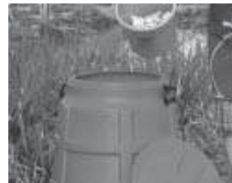
最近では手軽に堆肥が作れるようです