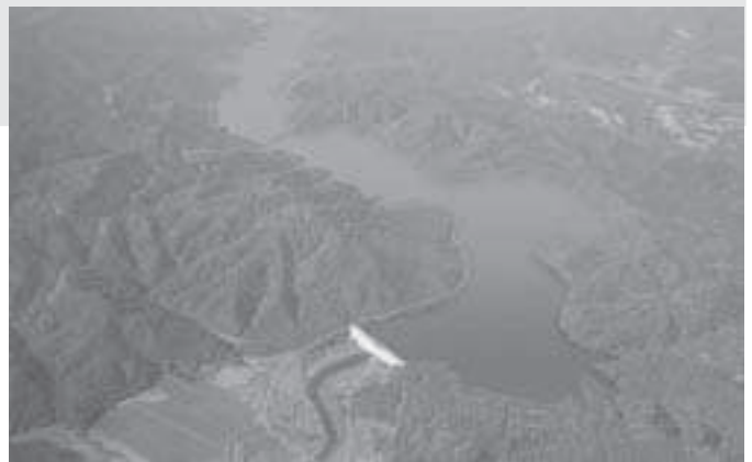
緑に囲まれた天然水をたたえるダム (当別ダムの完成予想図)

い洪水災害を防止するた め、当別ダムは無くては ならない重要な施設であ る。 当別町は北海道に対し てダムの背後地振興策な どについて要望したが、 この要望は百%満たされ るには至っていない。ダ ム工事で出来上がる湖を 当別町がまちづくりに活 用していくことは非常に 大切であり、ダム湖と道 民の森をリンクし、町民 はもとより誰もが楽しめる ような利活用について 議論を深めたい。