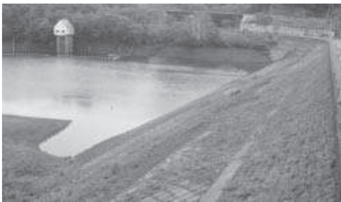
今夏の降雨は少なく、貯水率30%を切った青山ダム

しまふほどになつてい る。時は大きく変わつて 来ている。この先、水稲 作付が増加していくよう にも思われるが、そう願 うにも農業用水の確保は 絶対的条件である。農業 サイド、水道水の安定確 保からも当別ダムの早期 完成が待たれるのであ る。天から降つて来る雨 の調整はできない。しか し、雨が水に変わつてか らは人の手を加えること は可能である。既に本体 工事が進んでいる現在だ が、八月六日付の新聞に 一部の団体が今もって異 論の声を上げているよう だが、二十四年完成が待 たれる地元町長として、 揺るぎない見解を町内外 に発信していただきたい い。また、完成時には当 別町にとつてのまちづく りにどう活用を考えるの か。