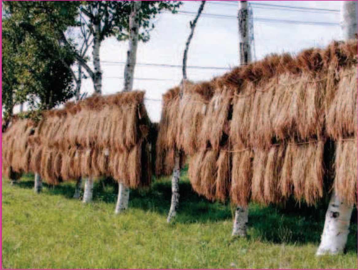
撮影：谷口洋人氏 提供 撮影場所：若葉