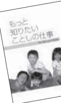
他町村の予算説明書