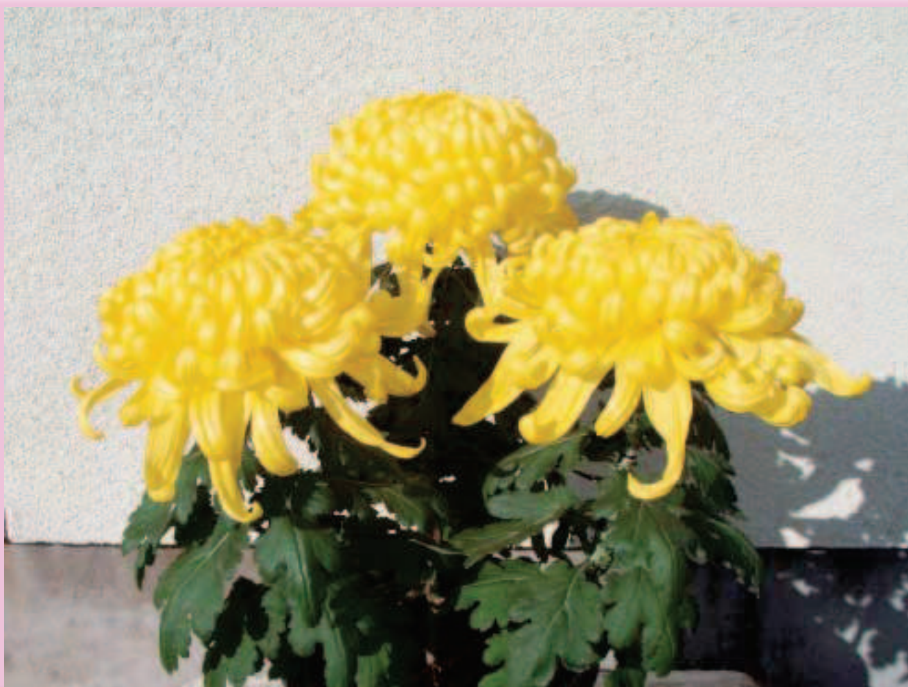
菊の花（浦田清一氏栽培：太美南）