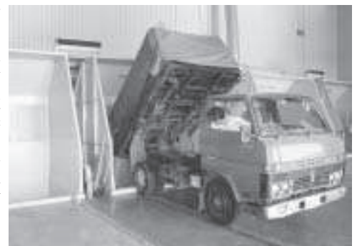
ライスターミナルに大地の恵みが搬入される(米)

政指導を受けた白木議員は、議員協議会などで発言を求め、釈明をされている。議会としても事実の全容解明に努力をすべきであると思いが、現在北海道警察の捜査中であるというところでその結果待ちの状況となっている。中央、地方を問わず政治家や議会に対する住民の不信が広がっている中で、町の施策との関わりもあり、支庁の「不法投棄に対する行政指導」が明らかになったこの問題について町長の受けとめ方、見解は。