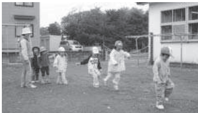
子どもと親が心安らいで暮らせることが 安心の子育て環境づくりにつながる...

う。地方議会は、議員同士の対立や町長、理事者側と議員が不毛の議論をするより協力、協議、議論をして、上位機関に協力して申し上げることが住民のためになると思う。