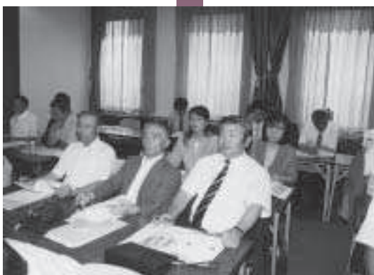
真剣に聞き入る議会広報委員