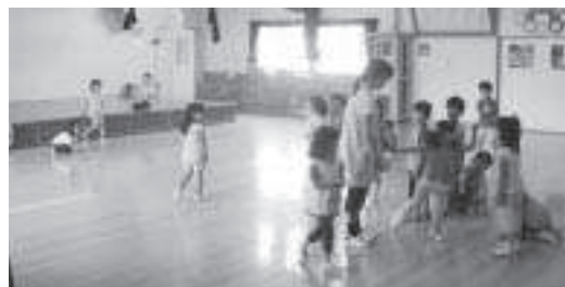
民営化による改悪教育は許されない！

って運営が放棄されたり、弊害が生ずる事態も各地で事例としてあると聞く。サービスを引き受ける法人の充分性、適格性の基準に対する教育長の考えを伺う。