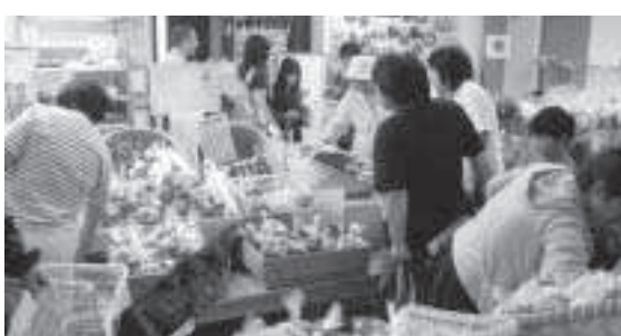
活気溢れるふれあい市場（赤れんが6号）

当別ブランドになる商品開発の実現に向けて、その第一歩とも言える当別軽トラックマーケットを成功させて次のステップへつなげていくことが非常に重要なことであると考えている。