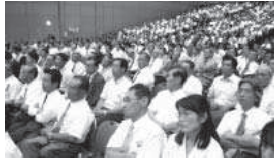
北海道町村議会議員研修（札幌市）