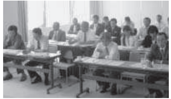
石狩管内町村議会議員研修（新篠津村）

平成20年6月26日には新篠津村において石狩管内町村議会議長会主催の研修会（講演：『後期高齢者医療制度について』）に、7月1日には札幌市で北海道町村議会議長会主催の研修会（講演：『分権改革と地方議会のこれから』ほか）に参加しました。