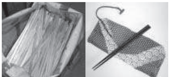
環境保全とごみ減量化のために割り箸からマイ箸へ

町長 マイ箸運動の趣旨と同様、環境の保全はごみの発生を抑制する上からも大切だと考えている。役場庁舎では、廊下や会議室などの蛍光灯の本数を減らし、どこでも電気がついていてということはなく、公用車も普通車を減らし、軽自動車に入れかえている。用紙は書き損じのリサイクル、冬期間の暖房は設定温度を20度にして、午後3時45分になったら消してしまふなど、ガソリンや燃料費の節約と同時に二酸化炭素の排出を少なくする