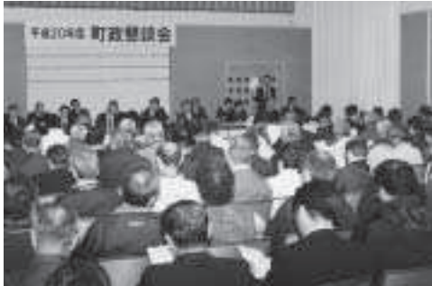
ざっくりばらんな雰囲気での話し合いを(ゆとろ)

問 今回の町政懇談会は、町が当面抱えている課題を住民に説明し、理解を得ることを主要な目的として進められたが、2、3の町内会単位でざっくりばらんに懇談、住民の要望や意見を聞く場として工夫が望まれる。