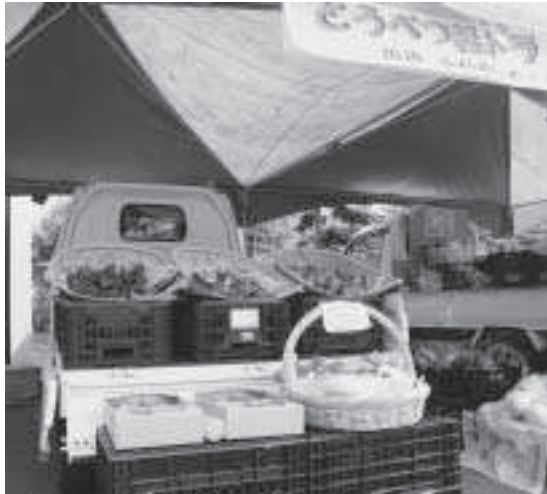
当別町の農業振興の起爆剤となるか？

問 町の農業振興策の一つである「軽トラックによる農産物の販売を行う青空市」の事業について、