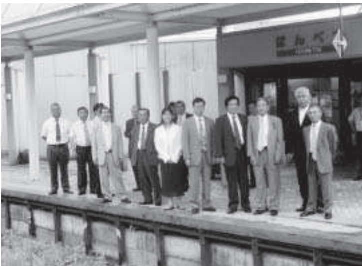
「道の駅」として整備された日本別駅

なお、もう一つの委員会である総務文教厚生常任委員会の所管事務調査は、8月上旬の実施を予定しています。