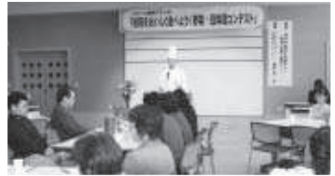
当別産の食材を使った野菜・豆のコンテスト

問 国が平成十七年七月、『食育基本法』を施行した。すべての世代の人々が食生活に関する正しい知識を持ち、真に豊かで健康的な生活を送るための食育運動を展開しようとするものである。朝食を抜く子どもがふえ、生活習慣病につながる中高年の肥満など、各世代で様々な課題を抱えている。平成十八年から国の食育基本法を基に「四年後にはすべての小中学生が朝食を食べるまでにする」、「各世代の食生活習慣の改善など具体的数値目標をもって、市民ぐるみで取り組む」といった自治体が増加している。