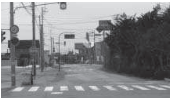
弥生町セイコーマートからの道道札幌当別線

化が進むなかで近い将来、町内会組織の運営が立ち行かなくなる地域も想定され、その対応を今から考えなければいけないとある。 当別町の今後の町内会についてどのようなことが想定されるのか。 町長 早い段階で町内会組織のあり方、各町内会二丁にに応じた連携、支援を行うため、方策について協議を進めなければならず、国の情報などを早く入手して、地域や各町内会代表者と連携して支援の方向性を考えなければならぬ。