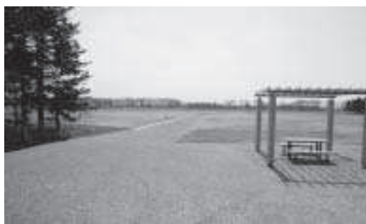
東裏体験農村公園

は考えている。農家の跡取り息子だけではなく、多様な担い手が農村の多面的な機能を生かすようになって、農村社会は国民の地域社会へと変わってきている。 これは私の持論であるが、農地があれば農村ではなく、そこに働く人がいて初めて農村だということも多くの方々に認識してもらいたい。そして、農家の温かさに直接触れてもらうことをするのに東裏は好ましい場所だと考える。都市と農村のかけ橋となるよう、東裏地区の住民の方が実践していただけることを願っている。