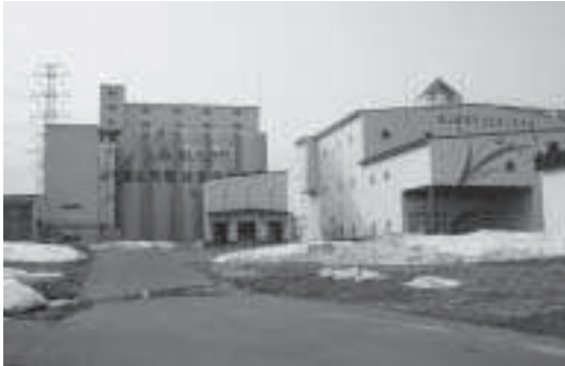
米・麦乾燥調製貯蔵施設

町長の政治姿勢について 問 我が国の食料自給率は、40%を切って39%に低下、食料の輸入自由化路線のもとで国内生産を縮小し、アメリカや財界のいいなりに国民の食料を際限なく海外に依存す