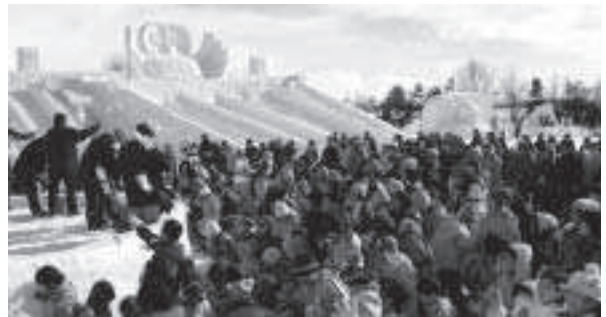
住民の協力により例年通り開催された第24回あそ雪の広場

問 二月にあそ雪の広場が開催された。今回は、町の助成が打ち切られて開催を危ぶむ声もあったが、住民の自発的な協力と参画により、例年に劣らない企画で多くの住民が当別の冬を満喫したと考える。これまでの事業に対する評価は、行政側からの評価という面が強かった。住民が自発的に財源を確保した上で実施したという事実は住民の質的な事業評価であった。こういった事業に町がどういう立場でどう支援しようとするのが大事である。赤れんが6号の運営や色々なイベントがあるが、こういった点について基本的な考えを示していただきたい。