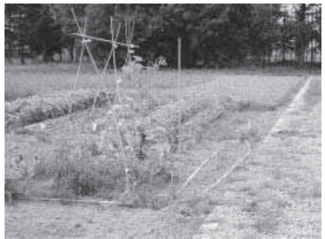
昨年の体験農村公園の作付の様子

昨年、体験農村公園に毎週のように野菜づくりの世話に通う家族、作業の合間にテントを張って田舎の自然環境の中で時を過ごしていく利用者など、一定の目的は達成されているが、さらにより多くの方に利用され、有効に活用するために本年度どのような運営を考えているのか。また、地域には、都市住民との交流に関心を持っている人たちもいる。利用者への農業体験サポートなど、地域住民の協力を得て進めることについて伺う。