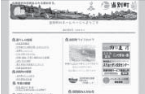
当別町のホームページ

ホームページの充実を 問 協働のまちづくりを進めるためには、情報が住民と行政の間で正確にわかりやすい形で共有されていることが重要である。情報の共有には、町のホームページは重要な役割を果たしているが、