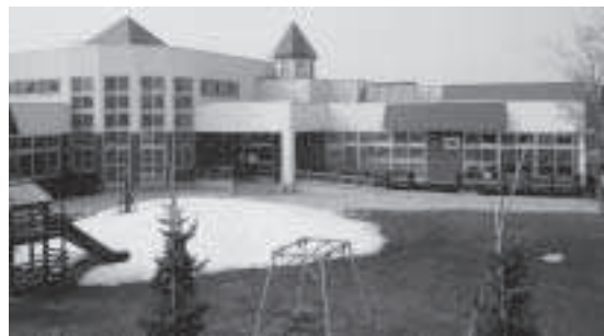
幼保一元化が計画されているふとみ保育所

討委員会を設置して検討し、町財政のひつ迫などにより認定こども園は民設により建設、運営するほうが有利だと平成二十年度町政執行方針で表明したが、保育所、関係者の理解をいただいて取り進めることになるが、民間での開設については、三、四年時間がかかる。