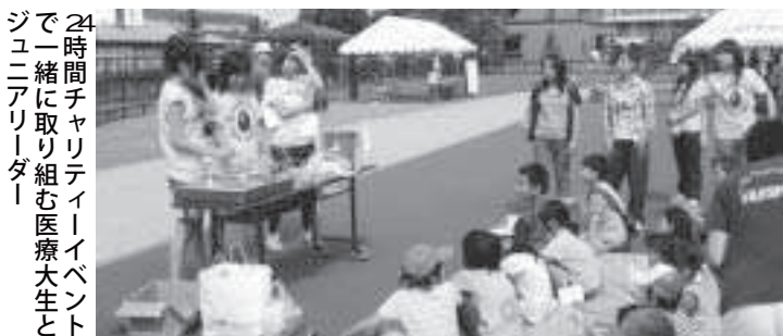
24時間チャリティイベントで一緒に取り組む医療大生とジュニアリーダー

問 近年、青少年をめぐる様々な問題が発生しており、その背景には『地域の教育力の低下』が指摘されている。学校支援地域本部事業は教員が子ども一人ひとりに対するきめ細やかな指導をするために多忙な教育を助け、地域全体で学校教育を支援する事業である。 子どもたちを地域総がかりで教育している、ある中学校の『よのなか科』の授業が注目を集めている。その学校は『地域本部』を設置し、地域の父母やOBなど多彩なスタッフと大学生が様々な活動で学校を支えている。「学校で教わる知識をどう使えば世の中で使える知恵や技術に変えられるか」を学び、授業に総がかりで取り組み、学力向上のみならず、人間力向上に多大な効果を上げている。知育、徳育、体育のバランスのとれた人間教育の実現こそ大事であると考えている。 学校支援地域本部事業の早期実現を伺う。