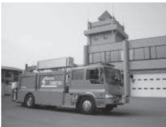
広域化計画がある当別消防署

とになり、都道府県は平成十九年度中に消防広域推進計画を策定し、平成二十四年度をめどに広域化を実現することとされている。北海道の消防広域化推進計画案では、札幌を除き石狩支庁管内の5つの消防本部を広域化しようとするものであるが、当別町の現状を考えると、救急医療、災害援助、それから教育、消防等の生活圏は札幌市とつながりが深く、札幌市を除く広域化は考えられない。北海道からの意見照会には生活圏を考慮し、札幌市を含めた組み合わせを計画することが望ましいと明確に回答している。