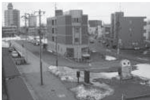
残雪残る当別駅前ポツポ公園駐車場方面

駅周辺利用者の短時間利用のために二十九台分管理しているが、夜間駐車を含めて長時間駐車が多く、赤れんが6号利用者の多くが利用できない状況から平成二十年度四月より夜間の使用を禁止し、赤れんが6号の開館時間の使用を検討したい。また、現在冬期間閉鎖しているポツポ公園駐車場は、通勤、通学者が利用できるように今年度から除排雪をやらなければならない。観光協会が設置したふくろうの看板は観光協会と相談し、町もできるだけ支援していきたい。