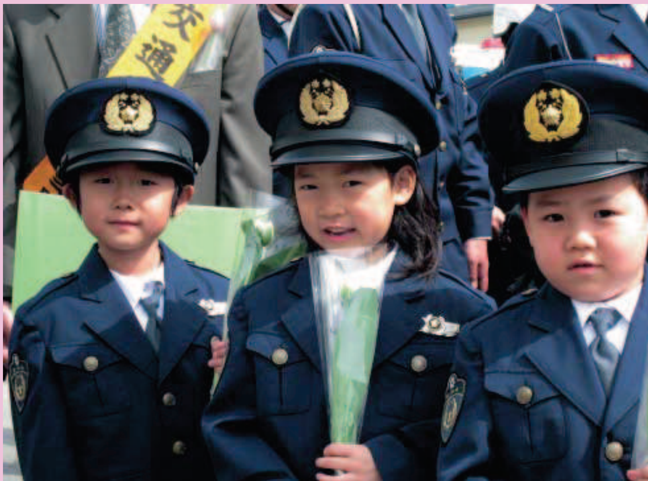
当別町「交通事故死ゼロを目指す日」&セーフティコール に参加した西保育所の園児たち(4月10日)