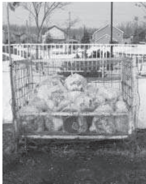
更なるごみの減量化が望まれる

女性の参加、有料化による効果など、審議会や関係団体などの意見を聞いて策定に努める。