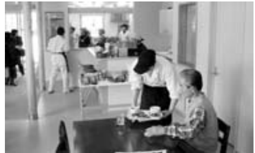
(共生型地域オープンサロン)