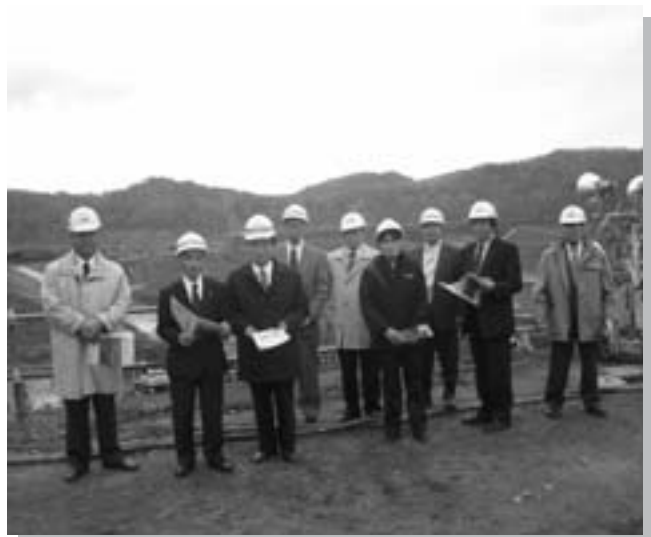
（産業建設常任委員会）