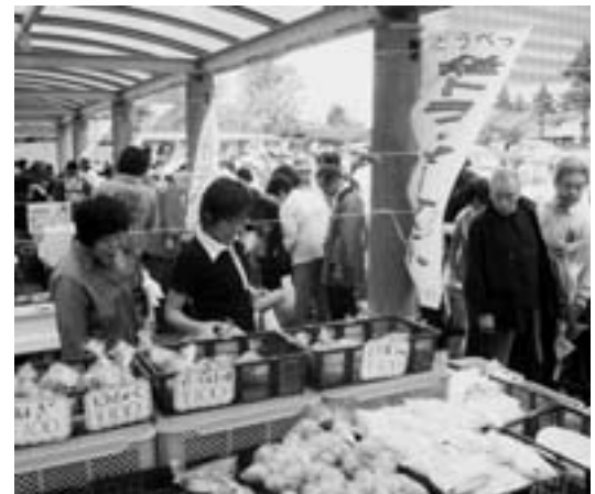
(大盛況だった軽トラマーケット)

12月19日には札幌市中央区南2条西5丁目東宝プラザ ビル1階に当別の特産品を販売するスペース「道産食彩 HUG(ハグ)マート」がオープンしました。