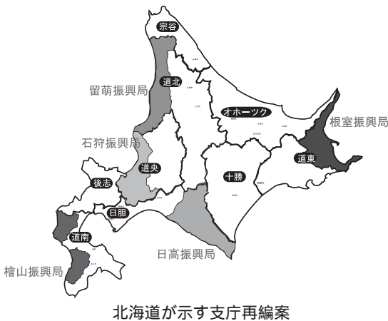
北海道が示す支庁再編案

新閣等で大きな動きがあったように報道されているが、国や道の対応を含めて現在、どのような状況で進められているのか。北海道町村会や道内の各町村の現状認識についても知り得ている範囲で回答いただきたい。