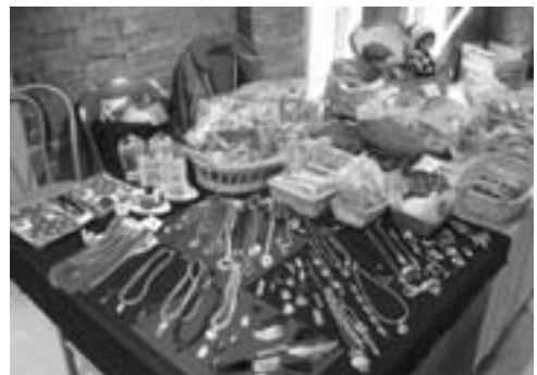
活気があり、好評だったふれあい倉庫の手づくり雑貨販売

当別町の農産物の知名度をあげ、店舗外販売を目的とした軽トラマーケット、情報発信などを目