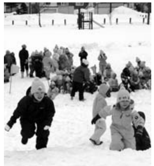
安全で教育格差のない地域社会の実現を！ （「雪に親しむ会」当別幼稚園）

最近では自動車のタイヤ窃盗事件も多発している。そういう状況から町は、当別町防犯協会や町内会、学校、保育所、幼稚園、地域防犯連合会、当別交番と密接に連携して青色回転灯を点灯して広報車両による防犯パトロール