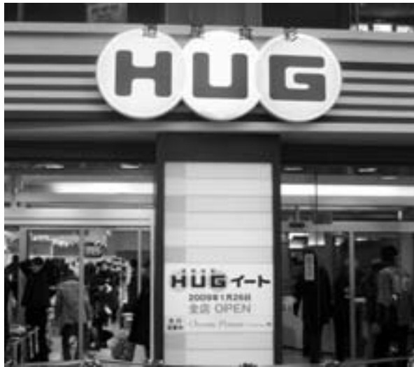
英語の「ハグ（抱きしめる）」と「はぐくむ」から名づけられたHUGマート。当別特産品販売のアンテナショップとして期待される。

また、「国民健康保険特別会計予算」の歳入歳出をそれぞれ百三十四万円増額する補正案、「後期高齢者医療特別会計予算」の歳入歳出をそれぞれ三十万九千円増額する補正案、「介護保険特別会計予算」の歳入歳出をそれぞれ三十七万四千円増額する補正案、「介護サービス事業特別会計予算」の歳入歳出をそれぞれ三十一万六千円増額する補正