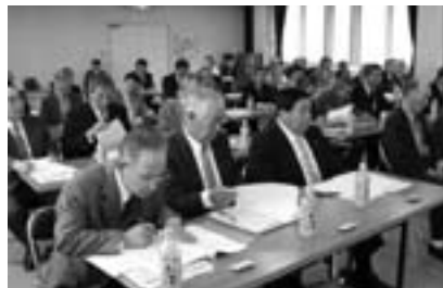
行政推進員制度との整合性は？ （行政推進員会議のようす）

「来年度から町内各地域を担当する町職員を配置し、地域活性化に役立てる地域担当職員制度を導入する」との北海道新聞（以下、道新）の報道があった。どのような目的で、どう進めようとしているのか。導入に至る経緯や現行の行政推進員制度との整合性、また、担当職員がその任に当たる際の身分はどのようなのか。町長 多くの町内会長が町の非常勤特別職である行政推進員を担っており、相当な負担をかけている