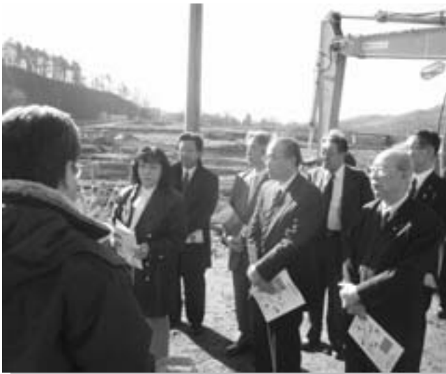
（総務文教厚生常任委員会）

総務文教厚生常任委員会が平成20年11月12日に、産業建設常任委員会が11月13日に、それぞれ当別ダムの本体工事現場等の現状と問題点を把握するため、調査を行いました。