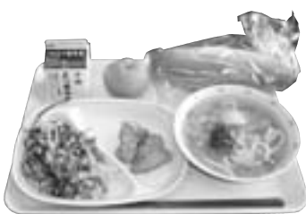
学校給食用メラミン食器

きている。早急に補修計画を立て、段階的に予算措置し、修理、買い換えを進めるべきであるが、メラミン食器の耐用年数は何年なのか、伺う。 また、化学物質への感受性が高いと考えられる子どもたちの毎日の生活の中から化学物質の低減を図るため、メラミン樹脂製から強化磁器食器などへ転換し、合成洗剤の石けんへの切りかえをすすめるべきである。 現在、使用されている合成洗剤の成分は何か。合成洗剤の成分はエクシード、成分はケイ酸塩、水酸化カリウム、カルボン酸塩、多価アルコールである。アレルギー対応は、年度初めに子ども、保護者との十分な協議の中で進めている。化学物質については、今使っているものが仮に問題であるという状況になったら、即座に対応しなければならぬと考える。 運営委員の一般公募は