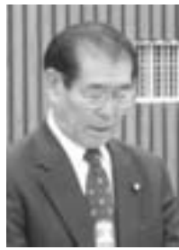
桐井 信征 議員