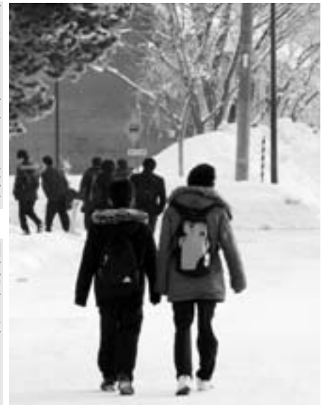
中高生が気軽に利用できる施設を

問 札幌市で十一月に子どもの権利条例が制定されたが、子どもの権利が尊重され、子どもが安心感と充実感を持って自分の町で暮らしていけると実感することができるようなまちづくりのため、子どもの権利条例を制定する考えはあるか、町長の見解を伺う。 また、当別町には中高生が放課後、無料で気軽に利用できる児童会館のような施設はない。 公共施設のロビーなどで、大人たちが温かいままなぎして迎え入れるだけでも中高生にとって居心地のよい空間になると思われるが、中高生の居場所づくりを町長はどのように考えているか。