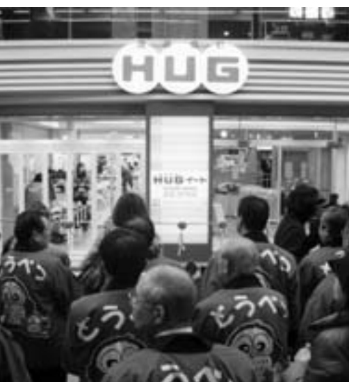
平成20年12月19日オープンの『道産食彩HUG(ハグ)マート』

今後は札幌市に隣接している利点を積極的に発信するために市内での産直市場への参加や札幌市中心部の狸小路に開設される道産品のアンテナショップにも当別の農産物を常時出品するなど、軽トラマーケットの成功を生かして、さらに発展する形へつなげた取り組みを進めていく。