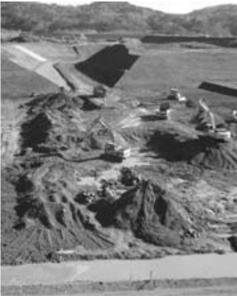
ダム工事による経済波及効果を生かすべき

町長 平成二十一年度以降は本格的に工事が始まり、最盛期には280人の工事関係者が当別町で働くことになる。聞いて