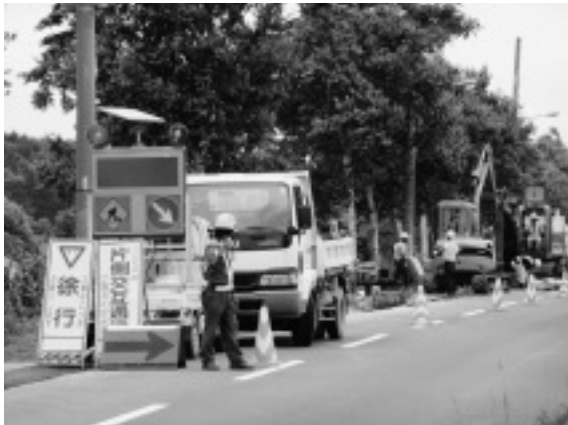
地元企業を優先した事業を実施せよ

問 地域経済と雇用環境は、一段と深刻さを増している。各自治体は、臨時交付金実施の準備に入っているが、「地域活性化・公共投資臨時交付金」「地域活性化・経済危機対策臨時交付金」などについて町民の福祉、生活支援拡充を図ることを基本的に下水道や生活道路、防災や環境保全型の事業など、地元企業を優先に雇用効果の高い事業展開をすべきと思うが、町長の考え方と具体策を伺う。 町長 経済危機対策臨時交付金の対象になるものは、56事業で総事業費40億円にのぼる。当別町への交付金は、2億1千万円と試算され、現在、事業の絞り込み作業をしている。 就学援助制度の拡充を問 子どもの貧困が大きな問題となっている。最近の子どもの置かれている状況（親の貧困が子どもに連鎖している実態）を教育長はどう受けとめているか。学校現場での教師の対応も含め、子どもたちに対する教育