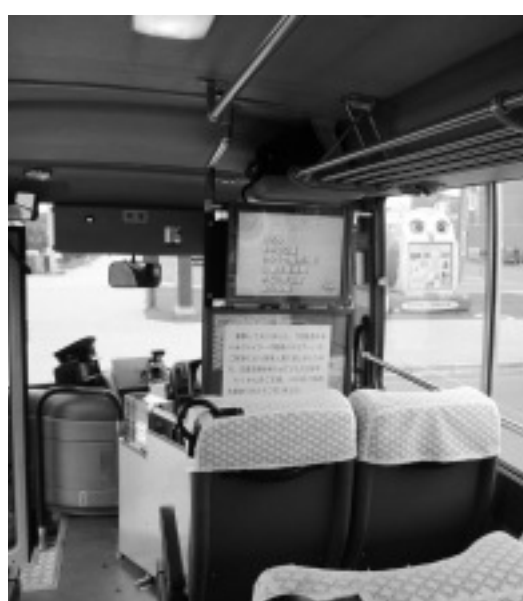
国土交通大臣表彰を受けたコミバス

このことは当然、町民にとって大きなアピールになるものであり、町の魅力アップにつながっていくと考える。