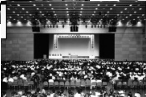
上：石狩管内議員研修 左上／左：北海道議員研修