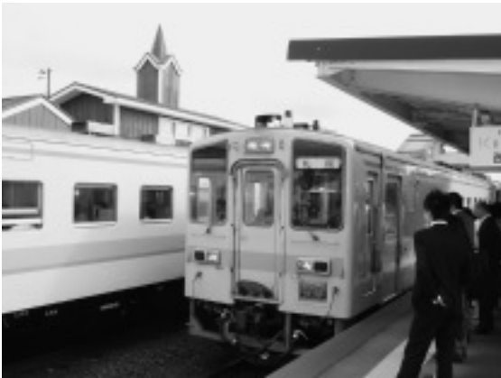
町民が受ける電化のメリットは大きい(JR石狩太美駅)

問 JR学園都市線(正式名称・札沼線)の電化整備は、新聞報道によると「JR北海道では平成22年迄に桑園からあいの里間を行うが、あいの里から当別、北海道医療大学までは23年以降の検討区間」とのことである。札幌圏で唯一、高速鉄道から取り残され、全線ディーゼル区間である学園都市線の電化が計画されたことは高く評価されるが、当別区間が検討区間という内容では、本町の町民にとって何の利便性もない。北海道医療大学までの区間が整備区間に取りこまれる様、町民あげての運動を展開すべきと考える。札幌まで30分台で移動できるという利便性を考えると、当別ダム建設の促進同様、町民あげての運動に持っていきたいと思う。