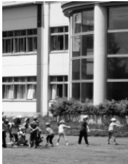
子どものための相談体制強化を望む

委員会としての支援策を特に講ずるべきではないか。経済的な支援で国の対策として幼稚園や高校生に対する支援策もあるが、小中学校の児童生徒に対する具体的な支援の一つ、就学援助制度は平成18年、基準の変更で対象が狭まり、該当者が前年の14%から11%になっ