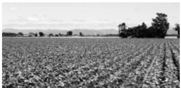
国の農政に左右されない 当別農産物のブランド化を

国は、札幌圏の高速鉄道路線の中に組み込まれ、一体的なダイヤを組むことができる。例えば、当別から札幌へ向かう電車が乗り換えなしで千歳空港へ乗り込むことも可能となり、町の大きな魅力にもつながると考えている。