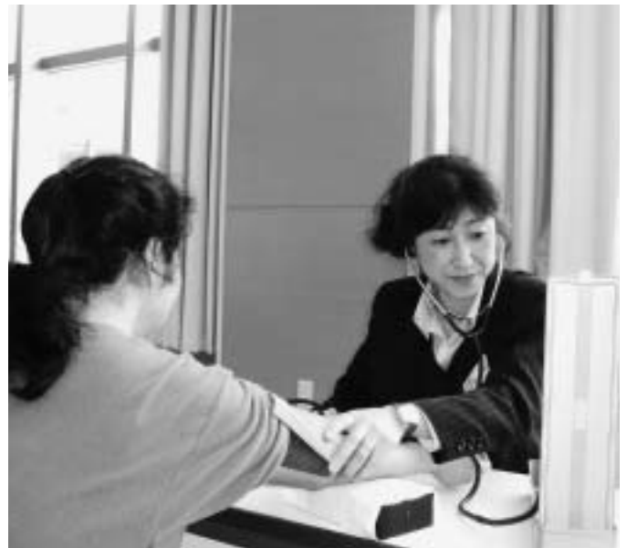
生活習慣病を予防するために

また、特定健診によって生活習慣が改善され、健康な生活を過ごすことに寄与し、多くの面で好結果が期待できると考えるが、今後、どのような成果に繋げるのか。受診率の実態と、今後