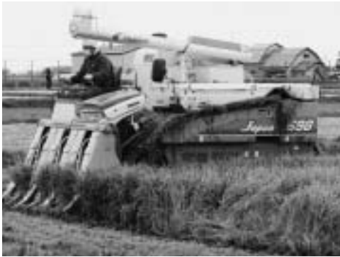
当別町農業を守れ

問 自公政治が終わって民主党中心の政権・内閣が誕生したが、民主党はその政権公約で日米FTA（自由貿易協定）交渉の促進を明記した。仮に締結されると日本の米は82%もの激減、大打撃を受け、穀物は48%が減少