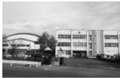
義務教育に地域格差があってはならない