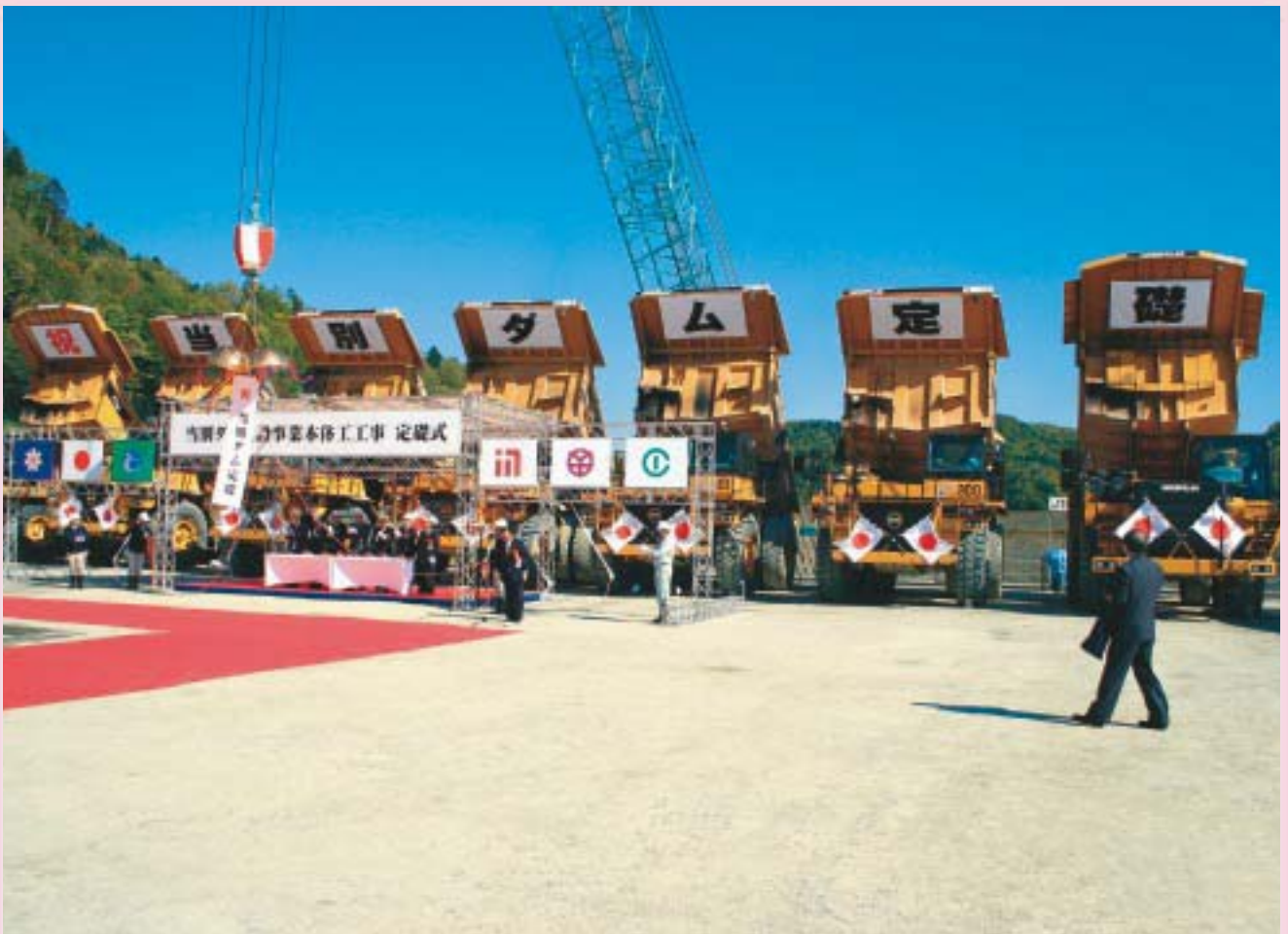
当別ダム完成に向けて 2012年の完成を目指し、10月10日に行われた「当別ダム定礎式」