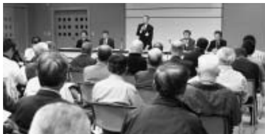
従前の懇談会だけではない情報発信を

として町民活動支援システムを整備し、多くの行政情報や地域の情報を、ITを日常的に使いこなす若者からITを使うことが不得手な高齢者に広めていただくことが、所信で述べた「地域で生きる情報」や「共同のまちづくりの推進」につながると考えている。