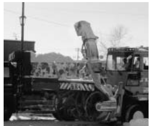
排雪費負担などは町民に丁寧な説明を

で行うことが困難になってきた。行政以外の新たな担い手と連携して公共サービスの質と量を確保していかなければならない。協働の取り組みを進めていくことは、住民と行政が協力して公共サービスを担うということであり、町民一人ひとりが互いに支え合うことのできる当別町の実現のために3期目も努めていきたい。