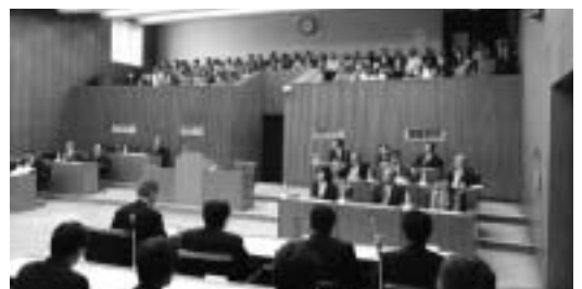
(平成21年第4回定例会)

どなたでも傍聴することができます。傍聴を希望される方は役場庁舎3階の傍聴席入口前でご署名の上、お入り下さい。なお、傍聴席数には限りがありますので、団体で傍聴を希望される場合は、事前に議会事務局へご連絡をお願いします。