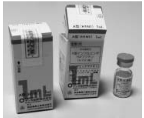
感染拡大を最小限に防ぐ対策を (新型インフルエンザワクチン)

町として感染拡大を防ぐため、どのような対策を講じていくのかを伺う。 町長 町内の幼稚園、保育所、小中学校での感染状況は、9月12日現在、A型感染者が9名、インフルエンザ様症状の欠席者が20名で、小学校1校で2学級が閉鎖されている。感染防止対策は、学校だけでなく周知されているほか、手洗い場の石けんの常備や来客用玄関、保健室にアルコール消毒液を設置し、家族に感染者が確認された場合は速やかに報告するよう周知されている。学校、幼稚園の臨時休業の目安は、A型インフルエンザ