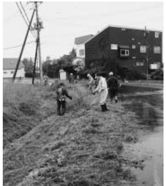
行政と住民が互いに自立した協働の取り組みを

協働は行財政改革の一環として町民の行わなければならない義務なのか。協働の指針では、「行政と住民が共通の目的のもとに地域の公共的課題を解決するために対等の立場でともに協力して取り組むこと」とある。対等であるならば、町民は一方的に義務を負うのではなく、協働する権利を有すると言えるのではないか。 協働の取り組みを推進するためには、町民の協働する権利、まちづくり