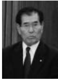
桐井 信征 議員