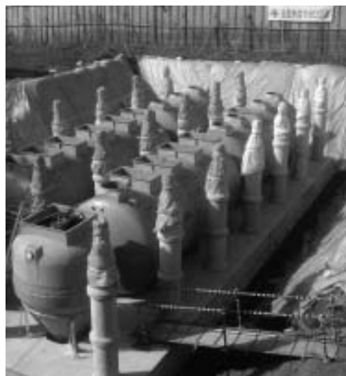
農村地帯のために合併浄化槽は必要

町長 プラン実施の4年間で22億8千万円、当別町の財源は不足になるとのことから、事務事業評価を実施し、歳出の削減や職員の手当てを削減するなどにより4年間で28億8千万円を削減できた。