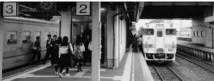
学園都市線電化事業の実現は今後も国に強く要望を

問 北海道医療大学までのJR学園都市線区間は、札幌圏域内でただひとつ残された非電化区間である。電化の実現は、長年要望を続けてきた当別町の悲願であり、電化の実現によって町民が受ける利益は計り知れないものがあると考えます。この電化事業の予算が国の新年度予算に確実に盛り込まれるよう、国に対して要望すべきだと思いますが、町長の見解を伺う。