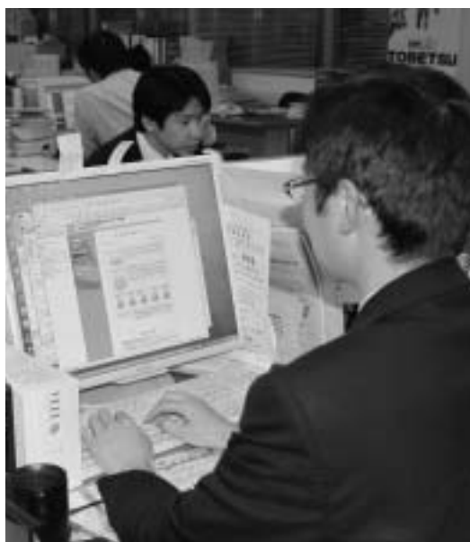
職員研修の機会は平等に確保されているか

町長 情報共有の推進の方向性だが、今後も町民が必要とする情報は、これまで以上に町のホームページなどを活用して迅速、かつ、わかりやすい