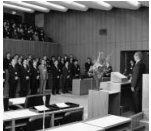
職責に合う報酬は自分で決めるものではない

う報酬は町長や議員が自分で決めるものではない。平成10年以来11年間審議会は開かれていない。人事院勧告は職員への給料引き下げの方向だ