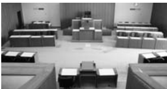
適正な町政運営のため様々な権限を持つ町議会

ただし、議会の招集は町長の権限であるため、延々と議会を開かなければ理論的には専決処分が有効となります。