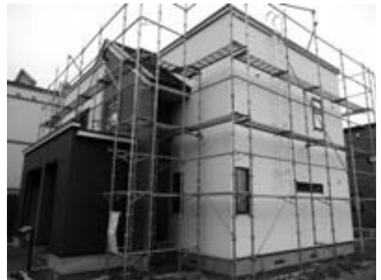
多岐業種への経済効果が 見込まれる住宅リフォーム

リフォームや増改築に支援することは町として大変厳しい状況にあることをご理解いただきたい。