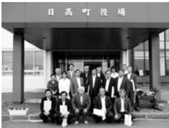
日高町役場では「市町村健康増進計画」と「国民健康保険事業」をテーマに飛び地合併による地域格差を克服した経緯などについての研修を行いました。