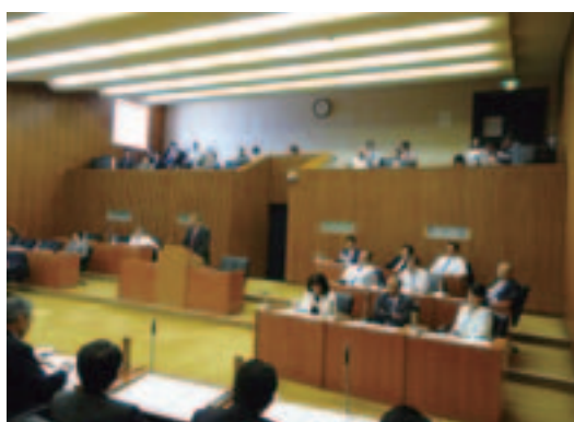
平成22年第3回定例会