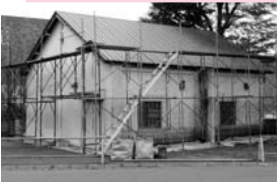
修繕される役場書庫