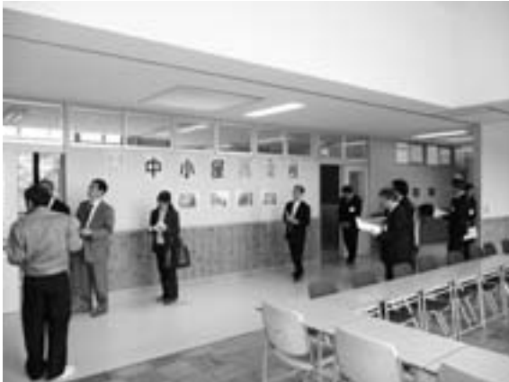
内閣府より地域再生計画の認定を受けて 中央設備工業㈱が利活用している旧中小屋小学校