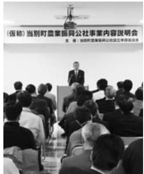
2月12日に開催された準備協議会の事業内容説明会

町長 振興公社の名称は仮称であり、事業内容は農業のみならず、農商工連携による経済振興を目指すものであり、この目的にふさわしいものとして「一般社団法人当別新産業活性化センター(以下、センター)」という名称案で協議しており、全町民の盛り上げに向けて着実に事業の仕組みやその方向性を見きわめ、進めていきたいと考えている。平成21年8月に準備協議会を立ち上げ、事業の核となる農業の現状と課題の分析を行い、振興公社の事業内容の議論を重ねてきた。12月には事業内容の中間の取りまとめを行い、本年1月に農業委員会、2月には協議