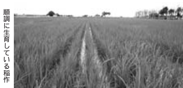
順調に生育している稲作

土地改良の予算も乱暴な削減によって本当に必要な工事にまで支障が出ている。土地改良区も予算減額と工期延長で冷害や湿害の影響が拡大される懸念を訴えている。 担い手育成や地域農業の振興に農協や関係団体の役割は欠かせないことから、その自主性を尊重しつつ本来の役割が果たせるように、町も協力し必要な農業予算の確保と今回激変緩和等で対応した転作物物についても地域の事態やこれまでの経過を踏まえ、しっかりと補償されていくように国に強く要望していくことについて、町長の姿勢を伺いたい。 町長 戸別所得補償制度（以下、補償制度）の本格導入にあたり、米、麦や大豆のほか、花卉や野菜などの産地づくりに努力を重ねてきた農業者の経営努力が報われ、持続的な発展が図られるような仕組みとなることが極めて重要と考へている。 北海道や町村会など関係団体は今月2日と3日に国の補償制度の確立に