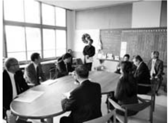
地域住民の有志による当別町田園文化創造協議会が 積極的に利活用している旧東裏小学校