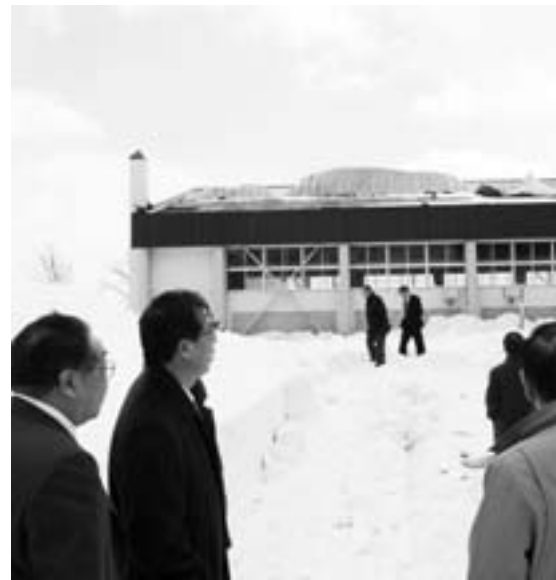
3月21日に発生した爆弾低気圧により北側の屋根がはがれた旧中小屋中学校体育館