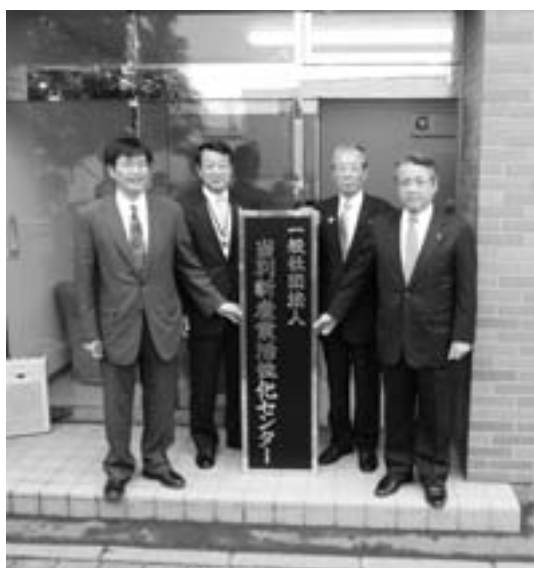
当別土地改良区の1階に設立されたセンター(7月1日)

問 当別の農業は地域を超えて世界のブランドになり得る力を持っていると考える。というのは、農業の技術支援を必要と