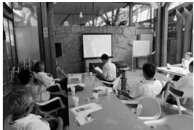
内子フレッシュパークからりてスクリーンを見ながら研修する議員団

24日に姉妹都市の愛媛県宇和島市を表敬訪問、表紙に掲載のうわじま牛鬼まつりを視察し、25日には愛媛県内子町の内子フレッシュパークからりて研修しました。単なる道の駅ではなく、レストラン、パン工房、キャンプ場などを併設し、コンピューターを利用した生産管理を行うほか、農薬や肥料の使用履歴をインターネットで開示するなどの先進的な取り組みは、当別駅前ふれあい倉庫のお手本となるものでした。政務調査費（せいむちょうさひ）とは地方議会議員が政策の調査・研究などの活動のために交付される費用のこと。当別町では平成15年3月に条例を制定しました（関連記事6頁）。