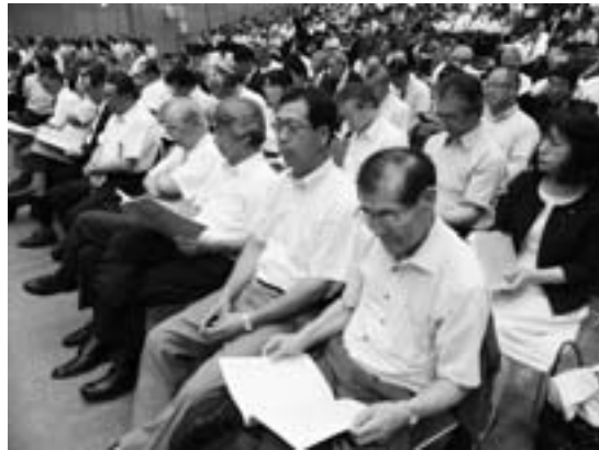
北海道町村議会議長会研修会