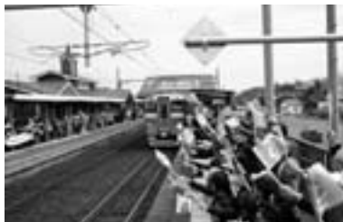
6月1日電化開始(7割が電車化)