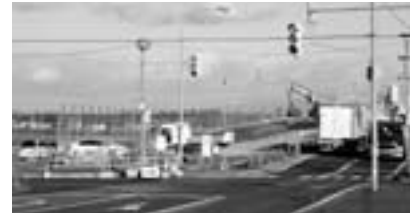
現在工事中の国道337号札幌大橋付近交差点

平成8年に実施した「道路防災点検」の結果をもとに地域要望などを含め、緊急性の高い箇所から地吹雪対策として防雪柵の設置を行っている。今後についても優先度を検討し、取り進めて参りたい。