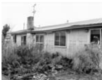
傾く屋根、不安な入居者（東町団地）

計画の策定にあたっては、多くの町民の声を聞くとともに、有識者の意見などを参考にし、取り進める考えである。