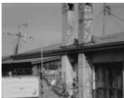
床も抜け今にも崩れ落ちそうな集合煙突（樺戸団地）

町長 現在、当別町住宅マスタープラン及び町営住宅長寿命化計画策定業務を行っているが、町営住宅の全入居者に対して、アンケート調査をすでに実施しており、9月24日に回収を終えている。