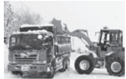
排雪費の負担軽減を