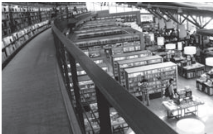
武雄市図書館はカフェと書店も併設されている

町長 学力向上対策と図書環境の充実は、非常に密接な関係があると認識している。あわせて、文化的な環境の充実といった部分でも、図書館機能の充実は、非常に重要な視点であり、人口増につながる施策であると考えているので、教育委員会と連携して進めていく。