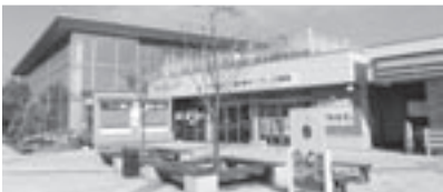
町の負担を少なくする方策は (写真は道の駅ふかがわ)

町長 町の持ち出しを少なくする具体策として、1つ目は各種補助金、交付金の活用。2つ目は出資者からの活用。民間企業からの出資と公的ファンドのA-FIVEの活用。3つ目は事業の共同実施。例えば民間企業等との共同事業化や国に要望中の国道337号への待避場設置の実現による国との共同整備も考えられる。国土交通省において、全国の既存・新規の道の駅の中から優良な道の駅を選定する事業に当別町も応募し、各関係機関を訪問し、当別町が目指す道の駅を説明し、一定の理解を得られたと認識している。