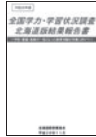
11月に北海道が公表した結果報告書

教育長 学力向上に向けた取り組みとして、授業改善と家庭学習習慣の確立が2本柱と考えており、授業改善はTT授業や少人数授業、習熟度別学習の実施などに取り組み、家庭学習習慣の確立は、当別町家庭教育の手引や各学校で作成している家庭学習指導資料などを中心に進めている。学力向上には、家庭学習習慣の充実が欠かせないと考えており、各