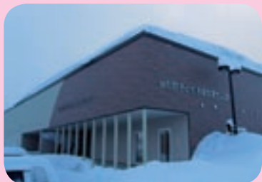
完成した当別町子ども発達支援センター