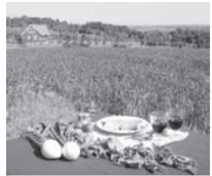
農業の6次産業化で付加価値を高める