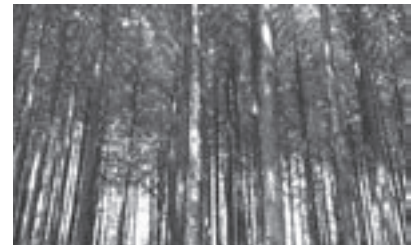
木質バイオの可能性は

町長 地域のエネルギー循環を構築していくためには、林業の振興も重要だが、エネルギー需要の門戸を広げていくことが重要と考えている。まずは公共施設での木質ボイラー導入の検討、各家庭や事業所における木質ストーブやボイラーの普及など、需要の喚起策と合わせて、検討