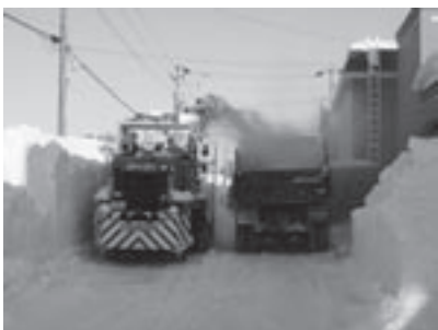
持続可能なまちづくりに除排雪の強化も必要

町長 先般、国会で地方創生関連法案が可決され、努力義務ではあるが、平成27年度中に当別町の人口ビジョンと総合戦略を策定しなければならず、国の地方創生の動きに連動して、支援を受けていくため、策定作業に入っていきよう準備を始めたところである。現在、産業化に向けて企業誘致や道の駅建設を中心に施策を進めている。住環境の整備として、雪対策や再生可能エネルギーの活用、魅力ある教育環境の創出としては、一貫教育の導入を進めており、これらの取り組みは総合戦略に盛り込むよう考えている。国からの支援を受けながら、また、国と連携した企画立案を行いながら各施策を執り進めつつ、発議のあった各項目に対応していくことで、人口の減少を止めることができると信じている。