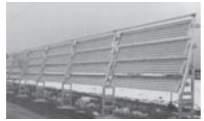
冬期間に必要な防雪柵

町内に多くの街路樹が植樹されており、非常に景観も良いと思う。いったん管理を怠ると繁茂となり除排雪にも影響が出る。一定の路線計画を