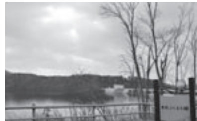
当別ダムは、観光の大きな資源

通学路でもある交差点に歩道がなく、コンビニ、ドラッグストア等、買い物客も多く、この地区にアパートも集積し、大学生、高齢者など通行に危険な状態となっている。特に冬季は車道に入る事から、顕著になる。区画整理事業でT字路から十字路になった際、行政も大きく関わってきた事業と認識している。しかし