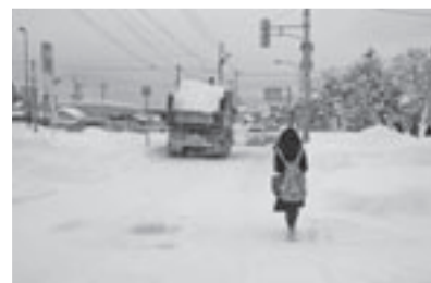
大型ダンプも通るが歩道がないため車道を歩かなければならない

問（再々質問） 通学路の編成で子供たちが不満を持つような事にならないよう、通り慣れた道を安全で通りやすくし、町長が言う定住人口を増やすためにも、優しい町、愛される町にするためにも、例えば少し歩けるようにする応急的な措置のようなことを考える方向に行っていただきたい。