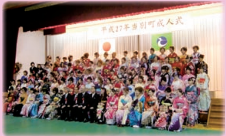
成人式で222人が晴れて大人の仲間入り