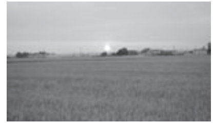
将来の当別町の農業ビジョンとは

T P P 閣僚会合が大筋合意に至らなかったが、行方によっては当別町農業に壊滅的な影響が予想され、日本にとっても大きな影響があり、多国籍企業のために市場原理を規範とした条約で農業、医療、介護、教育、公共事業など経済にかかわる多岐な課題がある。議会においてT P P 交渉断固阻止の意見書を採択済みだが、今後も情報収集に努め、影響について共有する事が大切と考える。新たな農業政策の対応について、今予算において農地基本台帳システム整備を始め各農地情報のシステム整備や更新が進み分析、管理が容