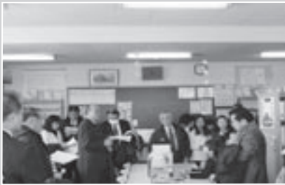
当別小学校図書室