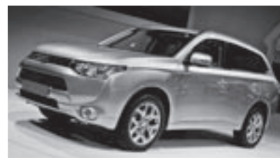
非常用電源搭載車として使用する車両

新年度は本町にふさわしい図書館像を検討する当別町図書館像検討委員会を設置し、できるだけ早