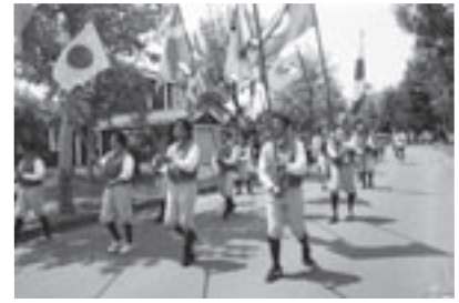
夏の大きなイベントの夏至祭

町に人を呼び込む施策として最も重視しているのは、基本構想を土台に町やタスクフォースが主体となって基本計画を策定するなど「道の駅」を早期に建設する事と考える。また、町をあげてのイベントを模索・検討するとのことであるが、交流人口を増やす観光振興も含めた検討も必要と考える。観光客の増加は、波及効果として雇用創出など地域経済の活性化、町収入の増加にもつながる事から、道の駅建設と並行して、観光地ブラ