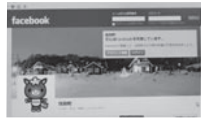
3月27日から当別町もフェイスブックを開設

文科省は昨年12月小、中学生に対して英語教育を充実させる方向性を打ち出した。他の授業と共に英語教育には電子黒板の活用を考える。電子黒板は、