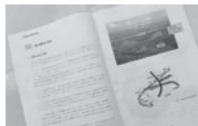
3月に完成した当別町道の駅基本構想

道の駅建設を推進していく、町長の強い決意を。道の駅構想は、宮司町長の目玉施策であり、町民にとって大きな関心である。