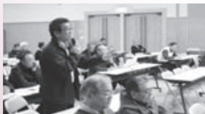
出席者から貴重な意見をいただきました