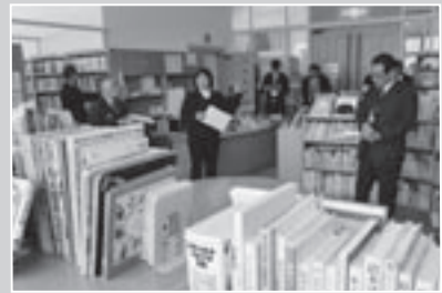
西当別コミュニティーセンター図書室