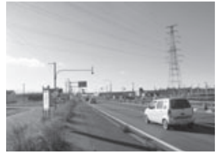
現在4車線化に向けて工事中の国道337号

町長 町政執行方針でも述べたが、現行条例においては特に食品関連産業の進出を誘導する内容となっている。本町の産業振興に結びつく業種の拡大と固定資産税や法人税の税制面における優遇措置ならびに一部公共料金についての軽減措置等を講じる方向で検討を進めている。また、誘致するにあたっては企業者からの要請にフレキシブルに対応できる体制も整えていく考えである。