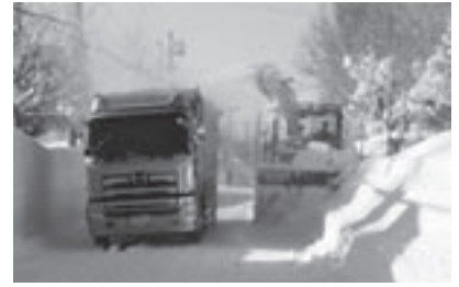
雪対策は毎年の課題である

2次産業である加工分野では、現在スーパーマーケットやコンビニ業界などで惣菜やカット野菜といった2次加工分野の市場が拡大傾向にあるが、町内には加工施設が極めて少ないことから、町内における2次加工の事業化を推進すべく、企業誘致も