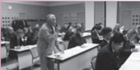
活発な意見交換が行われました