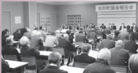
報告会のような様子