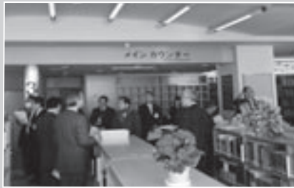
北海道医療大学図書館