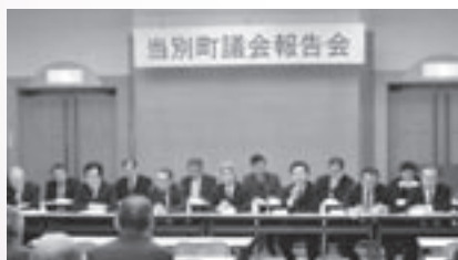
議会からは定例会の報告、議員定数削減の方向についての説明