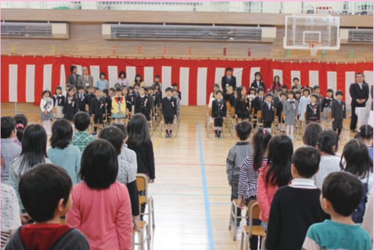
52人の新1年生。2年生との緊張のご対面（当別小学校入学式 4月6日）