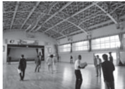
平成 25 年に改修した西当別中学校体育館