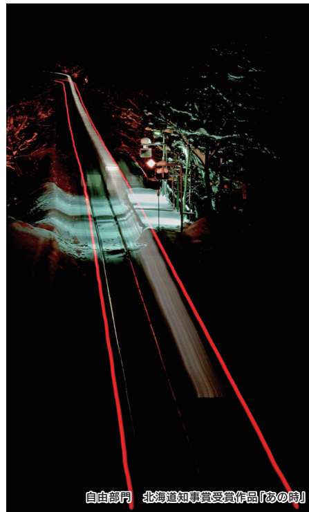
自由部門 北海道知事賞受賞作品「あの時」