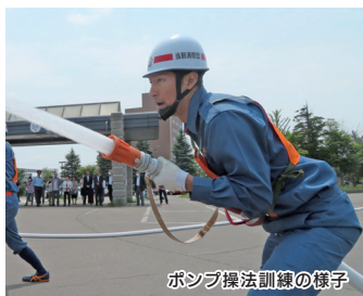
ポンプ操法訓練の様子