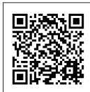
乳幼児健診 各種事業