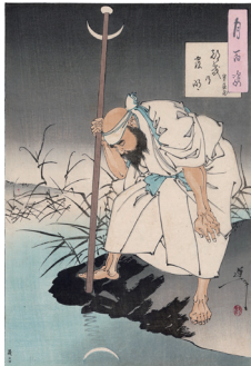
月百姿 寶蔵院 都幾乃発明(つきのはつめい) 浮世絵師:月岡芳年(1839-1892)