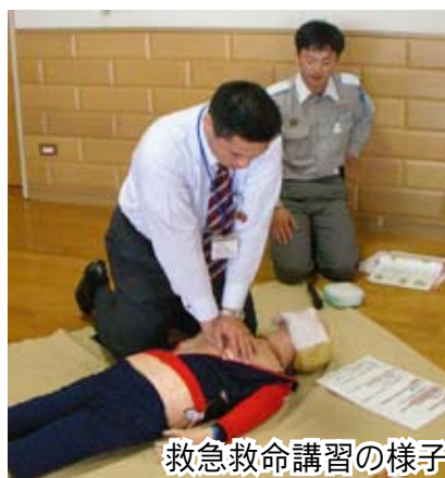
救急救命講習の様子