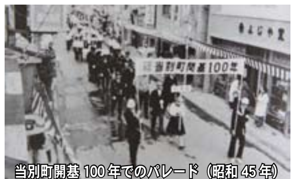
当別町開基 100 年でのパレード (昭和 45 年)