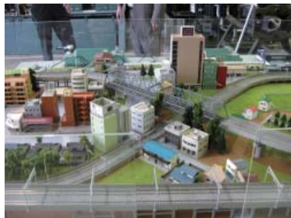
ジオラマの展示も