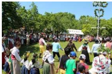
イベント実施の様子