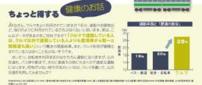
チラシ(左:表面・右:裏面)