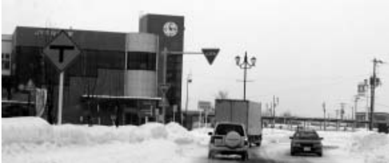
当別の要所 石狩当別駅

通勤、通学者や駅周辺利用者の駐車場である。今後、駅南広場の駐車場を駅周辺の利用者のための専用駐車として利用することを検討したい。大通りの街並み形成については、駅前のレンガ倉庫の整備と総合交通体系の確立によって、JRやバスの待ち時間にシヨッピングや軽食を取るなど、賑わいの創出につながり、必然的に通りの需要と価値は高まる。今までの議論の過程で町はそういう再構築プランを検討している。