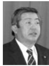
白杆 英男 議員