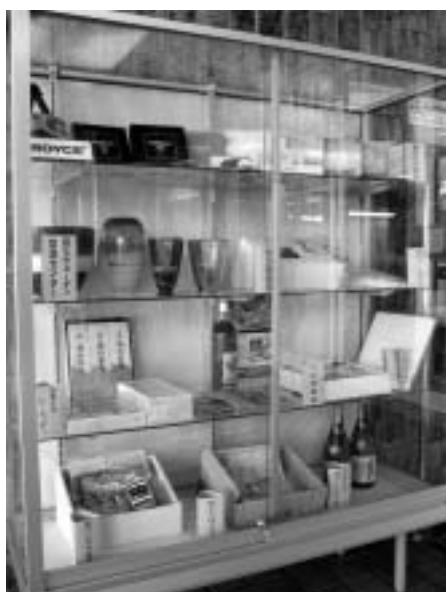
役場庁舎 入り口 町内 特産品コーナー

町長 緑豊か、自然、米、 麦の産地といった事は、 これはもう北海道どこで もの話で、当別だけが緑 豊かだという話ではない。 北海道の米がまだ道外か ら見ると混ぜる米という 位置づけの状況では、相 当な努力が必要だと思 う。町はまず消費者に特 産品として評価されるも のを当別で生産すること が必要である。それか ら、PR体制である。当 別の農家の一部と消費者 が地産地消を促進する会 を立ち上げている。そう いうグループのように原 材料を生産する人が次の 段階に行っていたらかな ければ、本当の強い一次 産業とはなっていないと 痛切に思う。