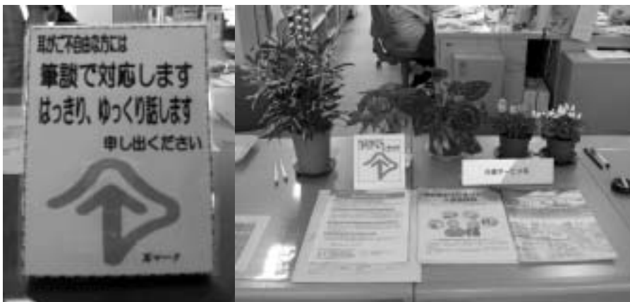
「はやくみんな（町民）にも浸透したらいいね」 町内各窓口で気軽に声をかけて下さい。

町長 当別町にはいろい ろな窓口があるが、町民 の方に対する窓口は、優 しく対応できるように努 力しているところである。 耳マークは文化庁に認知 されており、一つのアイ デアとして早速取り入れ る価値があると考えら れる。少しでも役場に来ら れる方々の不便を解消す る方策として早急に対応 したい。