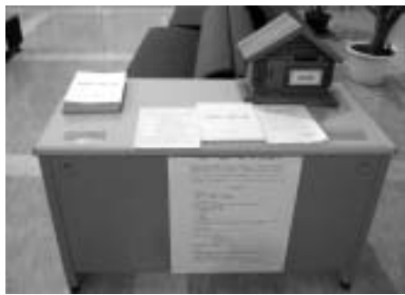
町内各施設に配置しています。

体系の検討や、新規の施設建設事業の抑制や公共事業の事業内容の見直しについて盛り込んでいる。住民サービスの向上では、現在行っている税務課以外の他の窓口業務でも、時差出勤による対応の実施について検討する。住民負担については、サービスの利用者として利用しない方との負担の公平性を欠くことのないよう、受益者に対して、サービスの程度と受益者の能力に応じた適正な負担を求めることを基本として見直しを図っていく。また、町税等では、滞納者が増加してきており、住民負担の適正化に影響がないよう、徴収体制を整備し、収納率の向上を図る。