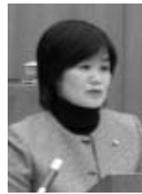
山田 明美 議員