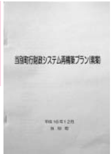
当別町の将来について みんなで知恵を だしあいましょう。

町長 このプランでは行財政システムを抜本的に見直すことが前提であり、プラン策定に当たり、幅広く町民の意見を反映させるため、ワークショップやグループインタビューを実施してきた。 現在、パブリックコメントを実施しており、多くの意見が寄せられるよう呼びかけていきたい。意見に対しては、十分検討のうえ、有識者で構成する策定検討会議でも検討いただき、その過程を公表していく。更に、プラン策定後の実施段階においても、それぞれの具体的な取り組みについて十分に説明し意見を聞いていきたい。いつまでしか意見を受けないという姿勢でなく、その都度検討の中に入れていきたい。