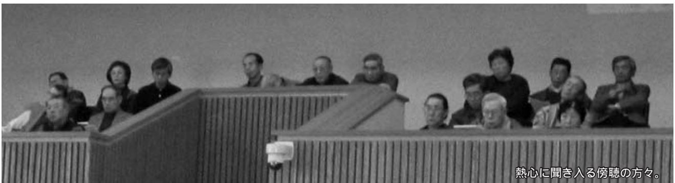
熱心に聞き入る傍聴の方々。