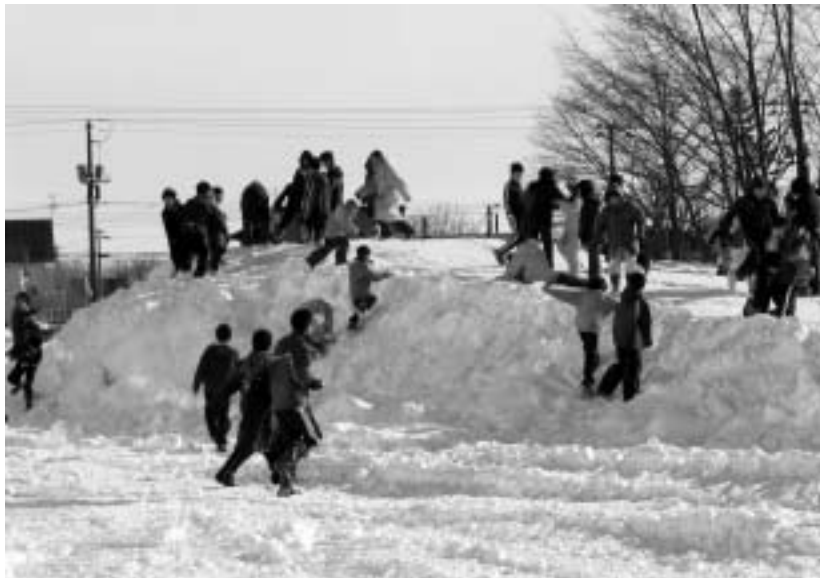
自由に遊び駆け回る子どもたち。発想も千差万別。 子どもの議論は時に大人を驚かす!!