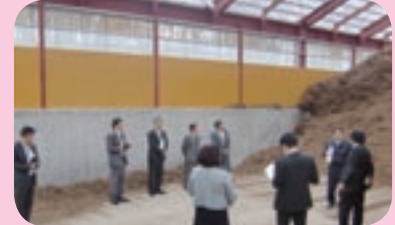
木質バイオマス施設の視察（南富良野町）