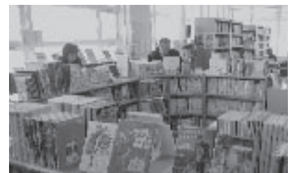
図書館の検討状況は (写真は西当別コミュニティセンター図書室)

町長 ふるさと納税の、寄附者による使い道の指定については、今年度1万件以上寄附件数がある中で、寄附者からの申し込みの際に、コメントをいただけるようにしているが、寄附者からの使い道に対する要望はほとんどない状況にある。町を応援したい、あるいは寄附者の真心というものは大切にしていきたいと思うので、今後寄附者から使い道に対して、要望が増えてきて、これにより寄附がさらに増えてくる場合は使い道指定について検討をしていきたいと考えている。