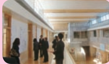
今年に完成した小中一貫校の視察（中標津町）