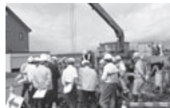
下水道管工事の視察（太美地区）