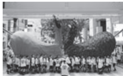
市外から多くの人が集まる姉妹都市宇和島市の「牛鬼まつり」

町ですべての危険空き家を除去する事は、財政的にも不可能である。そこで空き家条例に新たな制度を設け、助成等により地域での管理や利活用を促し、“自治の力”で問題解決を図る施策も必要と考えるが、町長の見解を伺う。