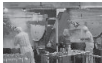
給食センターの調理風景

経済情勢、社会情勢、政治情勢、などがあり、実施前から見極めることは不可能であり、考えられる、あらゆるマイナス要因をなくし、失敗作にならないように行政挙げて実施していく。