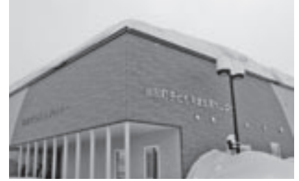
今年完成した当別町子ども発達支援センター

町長 現行の助成要件のまま、年齢の要件を3歳から小学校入学前までに、小学生から中学生までにそれぞれ引き上げた場合、具体的にはどの程度の財政負担が増加するのか計算すると、少子化の対策戦略プランに掲載しているが、400万円程度と試算している。さらに中学生までの年齢要件を今度高校生までとした場合には、高校生の場合は入院に至るような罹患率などを考慮すると100万円に満たないと試算している。子どもの医療費の助成制度は移住先を選択する際の重要な施策、重要視される施策であり、子育て世帯を当別町に呼び込むためには、少なくとも札幌市、江別市、石狩市という当