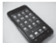
小学生、中学生のスマートフォン等の使用状況が大幅に増加

教育長 質問の平成 29 年を目途にということは、今まで発言したことはない。基本方針において有識者、学校関係者、保護者、地域住民等で構成される小中一貫教育推進懇談会を設置、開催し、その中で一貫教育についての理解や推進する際の課題等について検討を行っていく。