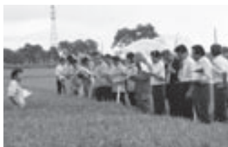
米の生育状況の視察（蕨袋地区）