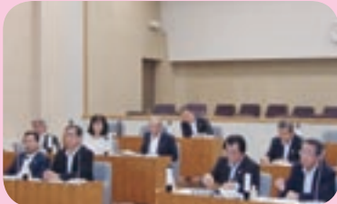
議場にて研修（芽室町）