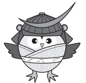
当別町イメージキャラクター とべのすけ