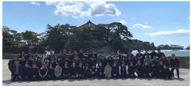
修学旅行3日目、松島での集合写真

挨拶や返事、受け答えがしっかりしている様子は、バスガイドさんとのやり取りのなかでも見られ、相手意識の高さを感じました。