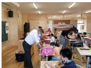
【放課後学習 前期課程】

教育の両輪は「学校教育」と「社会教育」です。当別町は、「チャイルドファーストの町 当別」のスローガンの通り、社会教育が充実しており、様々な取り組みをしてくれています！！