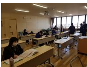
【放課後学習 後期課程】