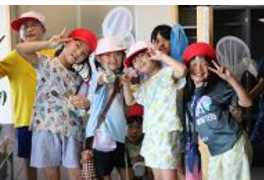
虫取りに挑戦！ (2年生)

稲穂公園で虫取りをしました。コオロギ、バッタ、蝶など、たくさんの虫を捕まえました。カエルもいました！！