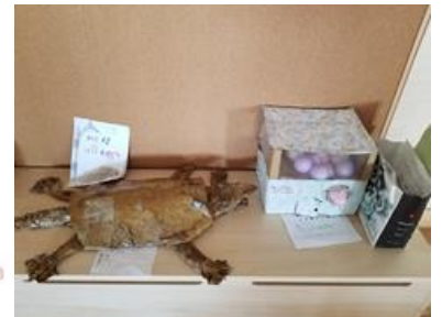
夏休み作品展 (1～6年生)

たくさんの作品が並びました！校内のあちこちに力作がそろい、見る人を楽しませてくれました。