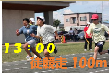
13:00 徒競走 100m