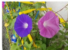
毎朝、朝顔が咲いています (1年生)

稲穂公園で虫取りをしました。コオロギ、バッタ、蝶など、たくさんの虫を捕まえました。カエルもいました！！