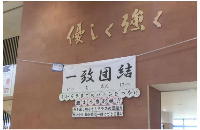
校内に掲示されたスポフェス スローガン