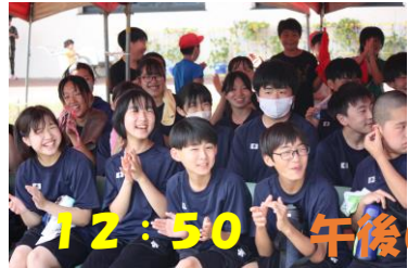
12:50 午後の部 開始前

流れる音楽に合わせて、紅組白組それぞれのチーム が一つになって、さあ午後の競技がスタート！