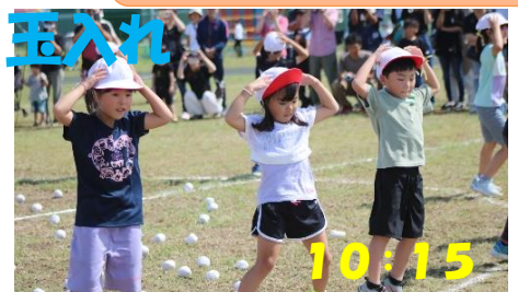
真剣な玉入れ。そして、ほほえましい踊り。1・2年生に癒されました。