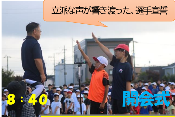
立派な声が響き渡った、選手宣誓