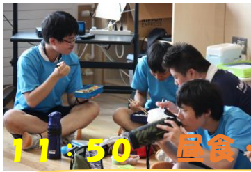
11:50 昼食・休憩・作戦会議

午前競技後、5年生以上は教室へ。 午後に向けて、学級の団結力を確かめ合う時間に。