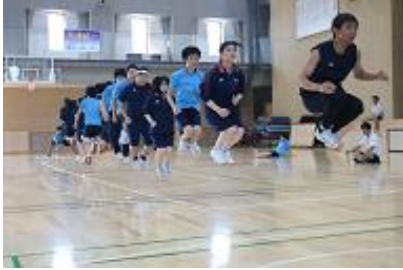
スポフェス練習 (9年生)

暑い日が続き、グラウンドでの練習が予定通りできないこともありましたが、最後のスポフェスに向け、一生懸命練習しました。