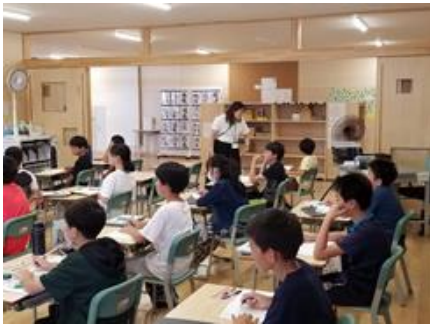
新しい授業のかたち (5年生)

前期課程に対し、石狩市の先生2名が、子どもたちが主体的に学ぶ授業や一人一台端末の活用方法を、授業を通して指導してくださっています。