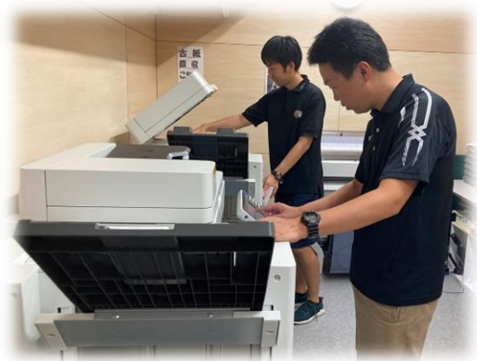
《セルゾナくん専属モデルの〇竹氏、〇桃氏》

とうべつ学園では、『職員間での提案・連絡文書や学級だより、個人情報文書はペーパーレス』と進めています。今まで早朝や深夜にこっそりプリントし続けていた某職員たち、昼間に事務職員の前で堂々とプリント活動をしていた職員も、常に「ペーパーレス」を心がけているはず。また、ミスプリントを多発させている先生方には、使用を制限するため、印刷のプロフェッショナルのお二人（事務嘱託員）にプリント印刷をお願いするよう勧めています。