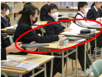
端末がいつでも使えるように、机上にスタンバイ