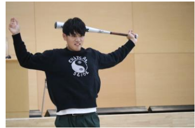
【ブンツと音が聞こえた素振り】