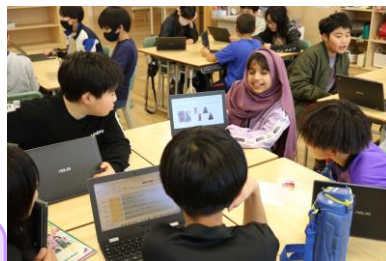
インターネット等で情報を収集、仲間と共有し、対話を通じて自分の考えやイメージを深化