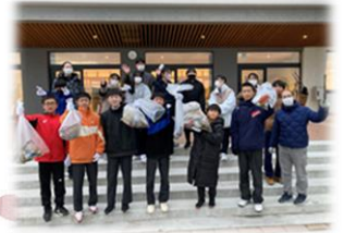
【生活環境委員会 ゴミ拾い活動】

とうべつ学園では、1～9年生を①前期課程・後期課程、②3ブロック（基礎期・充実期・発展期）2つの枠組みでとらえ、児童生徒の学びや育ちを多様な視点から支援し、教育活動を展開しています。