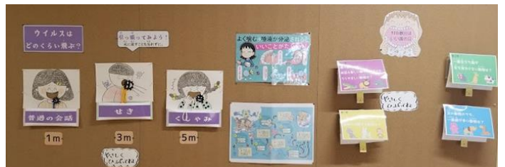
【保健室横の掲示板。今年、業務主事さんが作ってくれました】