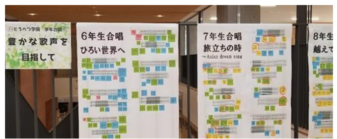
【後期課程教諭の教科担任制による専門的な指導】