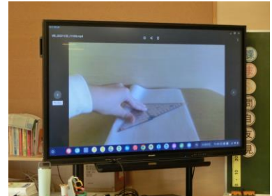
自分でショート動画を作成し、説明に活用