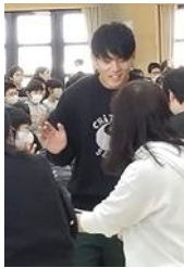
【全員とハイタッチ】