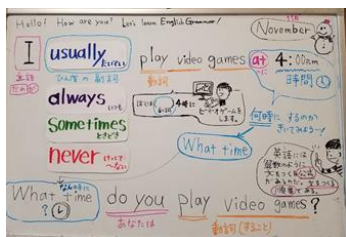
【外国語授業をまとめた掲示】