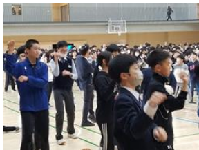
【お礼のきつねダンス】