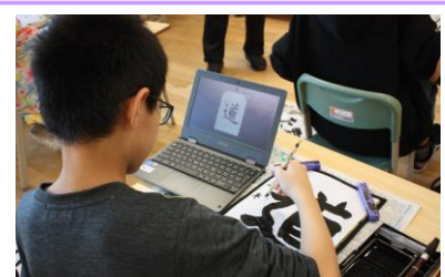
Webコンテンツを活用

上記以外にも、調べたことや意見、感想の共有、自分の考えの整理、校外学習の記録など、学習内容に応じて様々な端末の活用が図られています。今後は、家庭に持ち帰って活用する機会が増えることも考えられます。端末のより一層の活用について、保護者の皆様のご理解とご協力をお願いいたします。