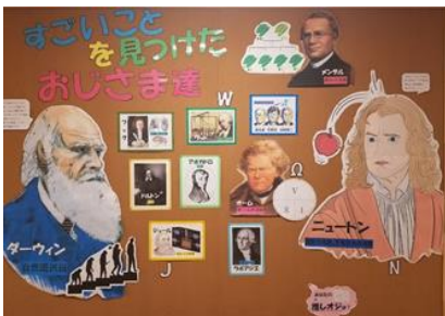
【理科専科が作った掲示。後期課程への接続を意識しています。】