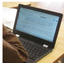
クラウドで、お互いの考えを集約、即時的に共有