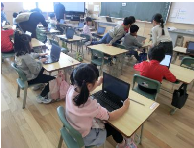
A Iドリルで学習内容の定着

令和2年に町内小・中学校に整備された一人一台端末について、今では、日常の様々な場面で活用され、子どもたちにとって、欠かせない学びのツールとなっています。例えば、次のような学習活動を行っています。