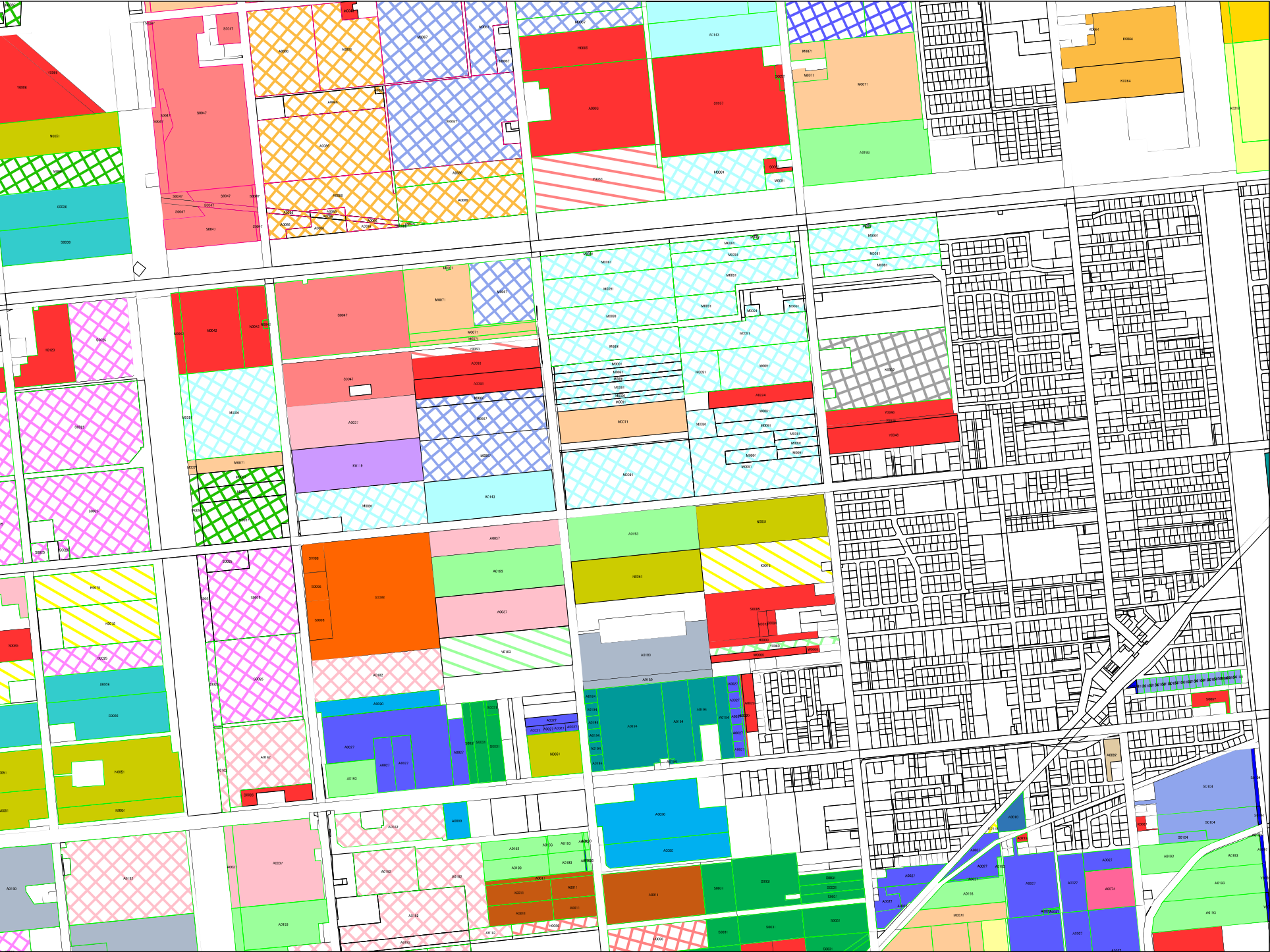
当别町目録地図 当别太、太美市街地区（当别太・太美市街01）